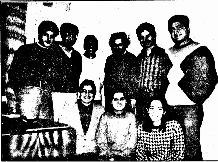
Ragıp ZARAKOLU, Dergimiz çalışanlarıyla.

PARTİZAN: Geçenlerde Gonzalo'yu yargılayan yargıçlardan birisi, Arjantin büyükelçiliğine sığındı. Yani biz biliyoruz ki Guzman'ın asılmasını istediğini açıklayan, ölüm cezasıyla cezalandırılmasını isteyenlerden birisi, Arjantin devlet başkanı Carlos Menem'di. Yargıcın Arjantin'e sığınmasını nasıl değerlendirmek gerekiyor? Zaten o karar vermiş-