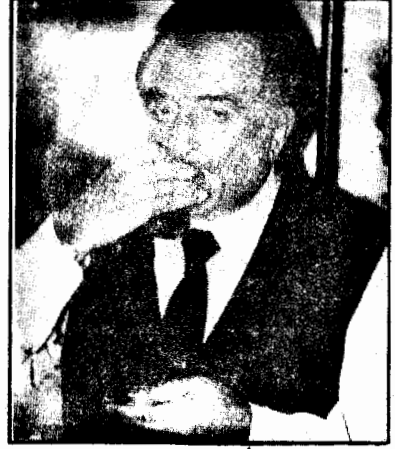
Cahit ARAL: "dinine imanına inanan Türkiye'de radyasyon var demez".

Dönemin Başbakanı Turgut Özal, Cumhurbaşkanı Kenan Evren Sanayi Bakanı Cahit