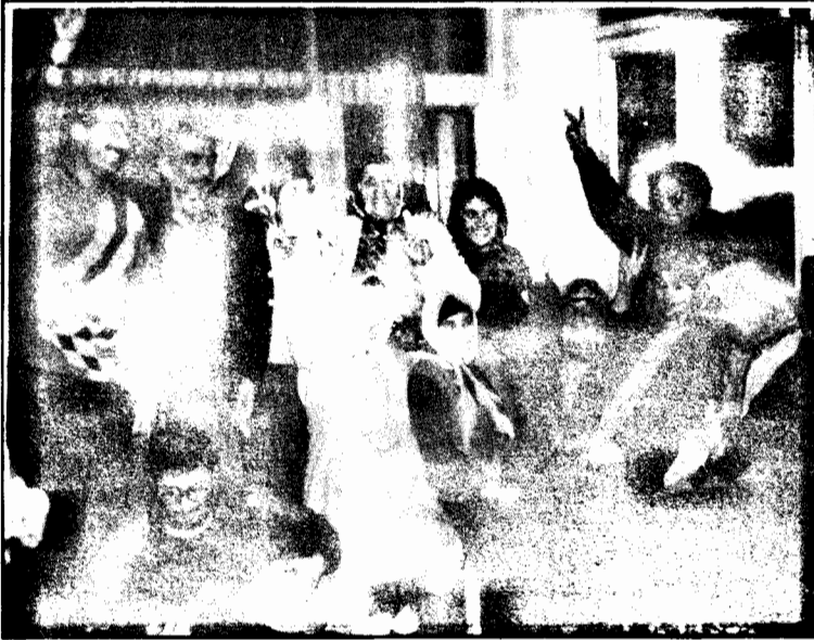
Tutuklu yakınları açlık grevinde

1- Avukatların üstlerini görüşmeye gelirken aranmaması. (Arama süresi görüşmeyi kısaltıyor)