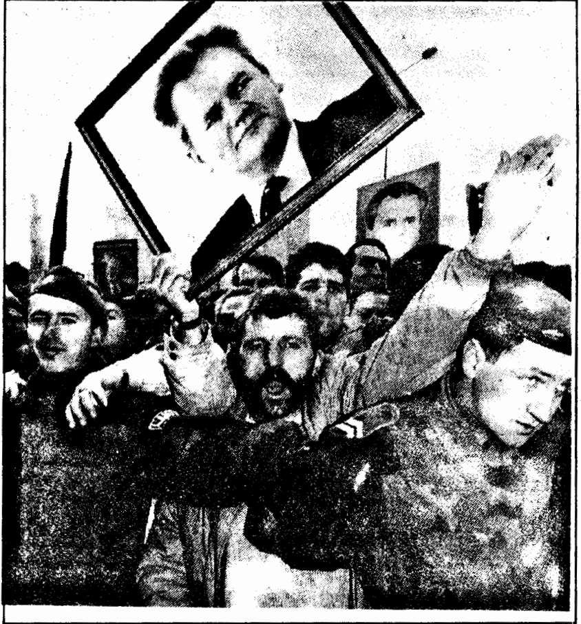
Emperyalistlerin kışkırttığı milliyetçilik kendi kasabını omuzlarında taşıyor...

ABD, Yugoslavya üzerinde etki alanları oluşturmaya çalışan Almanya'ya karşı Bosna-Hersek'i