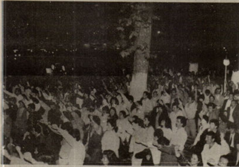
Binlerce sıkılmış yumruk gecenin mavi göğüne uzanıp yıldızlarla buluştu.

bu saatlerde konuşmacı arkadaşın, "Yeni Demokrasi 3. yıldönümü şenliğine hoşgeldiniz" hitabı bir anda herşeyi zirveleştirmeye yetti de arttı bile. Artık herkes ayakta ve alkış halindeydi. Birkaç dakika sonra da devrimin retorik ideali uğruna şehit düşenler için gecenin mavi göğüne uzanıp yıldızlarla buluşan binlerce sıkılmış yumruk ve yüreğe tanık olacaktık hep birlikte.