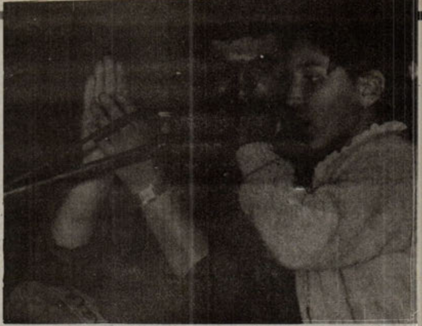
Ferhat Tunç... Türkülerini özgürlüğe, dağlara ve uzak insanlara ithaf etti.