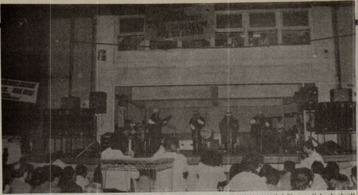
Peru'lular... And dağlarının "alıcı kuşları"