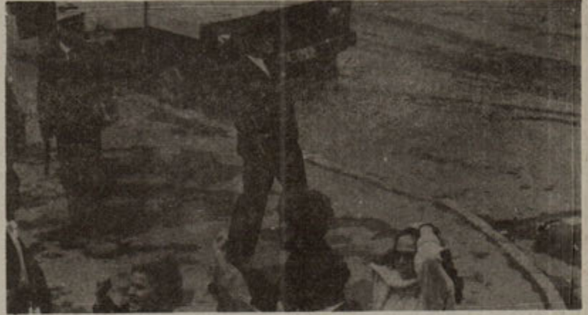
Büyük Komutan Bekçi, Operasyon Yürütürken...

Tutuklu yakınları ve devrimci güçler her fırsatta egemenlerin bu saldırılarını lanetlediler. Günlerce C.evi kapısı önünde bekleyerek özgürlük mahkumlarını yalnız bırakmadılar. Çeşitli merciler nezdinde girişimlerde bulundular. Millet Meclisi'ne, Adalet Bakanlığı'na çıkıp çocuklarının yanında olduklarını, onları yalnız bırakmayacaklarını gösterdiler.