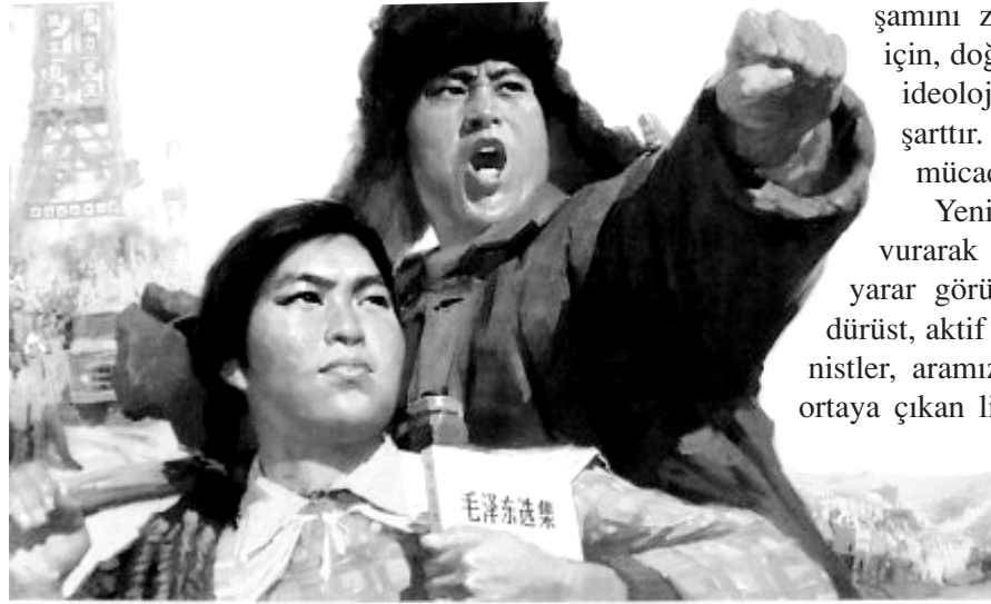
狠批“四人帮”掀起工业学大庆农业学大寨新高潮

Yeniden Mao yoldaşa başvurarak son noktayı koymakta yarar görüyoruz: "Bütün sadık, dürüst, aktif ve açık yürekli komünistler, aramızdaki bazı kimselerde ortaya çıkan liberal eğilimlere karşı koymak için birleşmeli ve onları doğru yola getirmelidir. Bu, ideolojik cepheimizdeki görevlerden biridir".