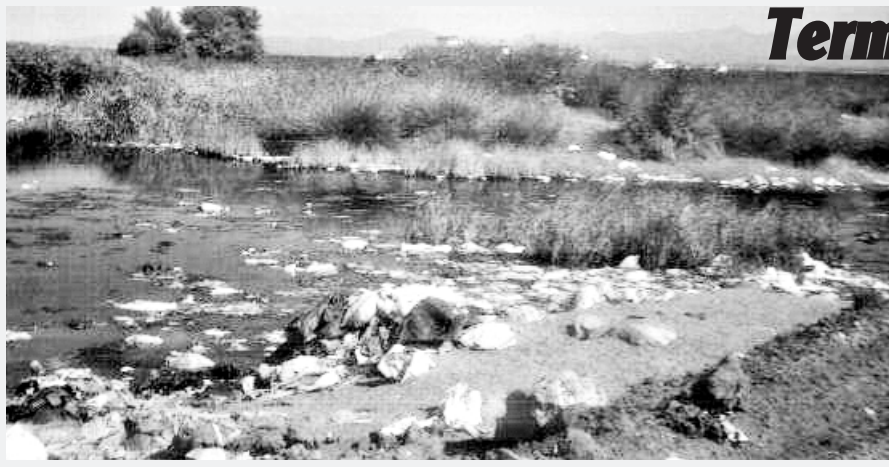
“Burası eski Terme ırmak yatağının kolu. Balıkların ölmesinin sebebi çöplüğün burada bulunması. Belediye'nin çöplüğü 3-4 yıldan beri burada.”

Terme Belediyesi, Terme Çayı'nın Karadeniz'le birleştiği deltayı çöplük olarak kullanıyor. Terme'nin Yalı Mahallesi olarak da bilinen yerde yerleşim yeri olmasından kaynaklı köylünün hayvanlarını otlattığı yerde belediye 3-4 yıldır çöpleri biriktiriyor. Bu yüzden mahalleye, köye çok yakın olan yerde kokudan durulmuyor. İlçenin çöplerinin biriktirilmeye başladığı zamandan günümüze biriken çöplerin açıkta dağınık durması, dayanılmayacak derecedeki koku ve yaydığı mikrolar nedeniyle halkın sağlığı bozuldu. Hayvanların hastalanıp ölmesinden endişe eden halk, Terme deresinin eski yatağında balıkların ölmesini örnek vererek Terme Belediyesi'ne karşı tepkisini dile getiriyor. Hal-