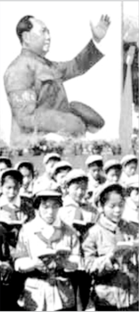
(Ko Çeng- Peking Review 30. Sayı 25 Temmuz 1969)

Gazetemizin daha önceki sayılarında da işlediğimiz bir konu olan siyasetle ekonomi, devrimle üretim arasındaki ilişki ve proletarya diktatörlüğünü yükseltme, sosyalist yolu tutma ve gerçek sosyalist ekonomik inşayı gerçekleştirme üzerine olan bu yazıyı önümüzü açıcı olduğunu düşünerek yayınlıyoruz.