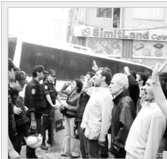
Sokak infazlarından, gözaltına alınanlar hakkında bilgi verilmemesine, insanların sokak ortasında kaçırılarak, katledilmesi ya da bırakılması artık bu ülkenin mevcut yasalarındaki yerini aldı

Bu ağırlık ise kuşkusuz dünya ezilenlerine çıkarılacak olan faturanın kendisinde açık bir şekilde görülecektir. Meselenin Lüb-