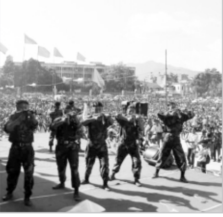
Büyük Gençlik Eylemi

Dünyanın çatısında kızıl bayrağımızı dalgalandıran Nepalli Maoistlerin 10 yılı aşkın bir süredir başarıyla sürdürdükleri Halk Savaşı'nı ülkemizde de elimizden geldiğince takip etmeye çalışıyoruz. Emperyalizme, faşizme ve feodalizme karşı bağımsızlık, halk demokrasisi, özgürlük ve sosyalizm şiarlarıyla, emperyalizmin yaşam bulamadığı başka bir dünyayı tanımlayan ve toplumun gerçek dönüşümü için emperyalizme ve yerli uşaklarına karşı silaha sarılan Nepal halkına önderlik eden yoldaşlarımızın izlediği çizgiyi anlamak, sorgulamak ve deneyimlerinden öğrenmek için sınırlı olanaklarımızı mümkün olduğunca kullanmaya dikkat ediyoruz. İşte Nepal devriminin içinden geçtiği böylesi kritik öneme sahip bir dönemde Kathmandu'da gerçekleşen 2 Konferans'ın davetiyesini alınca Nepal devrimine doğrudan tanıklık edebilmek amacıyla Yeni Demokrat Gençlik adına Nepal'e gidiş hazırlıklarına başlıyoruz.