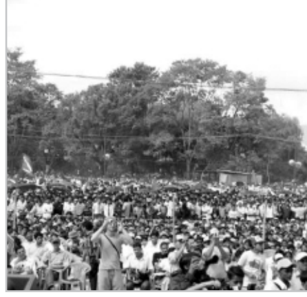
Büyük Gençlik Eylemi

Nepal halkı, kendisini yüzyıllardır otokratik, feodal rejim altında bastırarak, halkın köleleşmesine hizmet eden kast sisteminin altında boğan, eğitimden, sağlıktan ve insanca yaşam koşullarından mahrum bırakan, ülkenin yeraltı ve