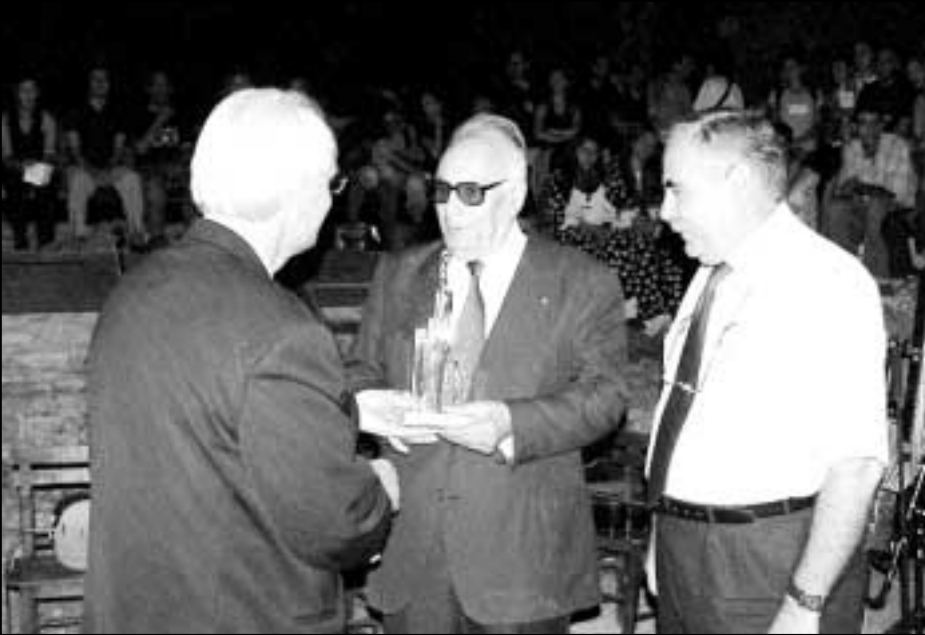
40.'sı düzenlenen Uluslararası Troya Festivali'nde bu yılki Homeros şiir ödülü Yaşar Kemal'e verildi.

Çanakkale 40. Uluslararası Troya Festivali kapsamında verilen Homeros Şiir Ödülü, bu yıl Yaşar Kemal'in oldu. "Troya Evlatlarını Çağırıyor" teması ekseninde düzenlenen festivalde, ödül töreni Troya Ören Yeri'nde gerçekleşti. Festivalin açılış konuşmasını yapan Çanakkale Belediye Başkanı Ülgür Gökhan, geçen yıl ilkini Alman Krista Wolf'e verdikleri Homeros Şiir Ödülü'nün ikincisini Yaşar Kemal'e verdikleri için mutlu olduklarını söyledi.