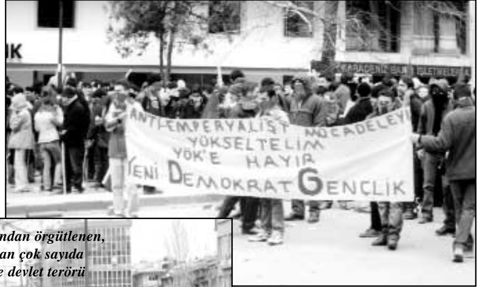
13 Mart İnişiyatifi tarafından örgütlenen, Türkiye ve T. Kürdistanı'ndan çok sayıda öğrencinin katıldığı eylemde devlet terörü yaşandı.

ne kadar geldiler. Partizan flamaları ve kızıl bayrakları ile disiplinli bir şekilde YDG kitlesi de dövizleri ile YÖK Yasa Tasarısını ve Kamu Reformunu protesto ettiler. Saat 13:00'te polis barikatıyla karşı karşıya gelen kitle barikatın kaldırılmaması üzerine beklemeye başladı. Yaklaşık 1 saatlik