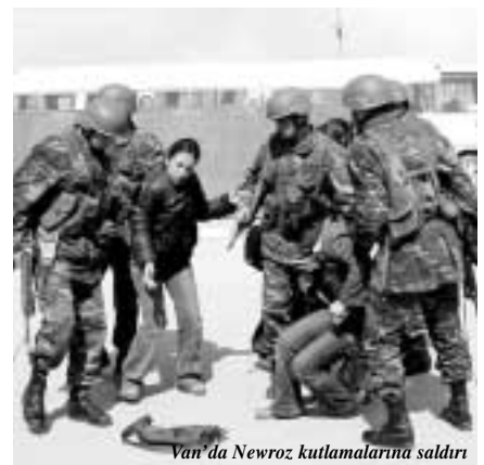
Van'da Newroz kutlamalarına saldırı