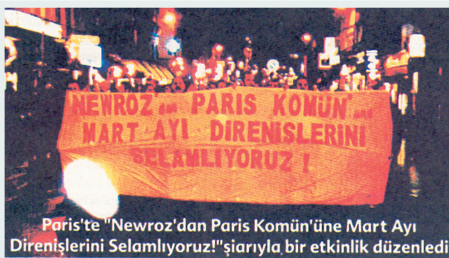
Paris'te "Newroz'dan Paris Komün'üne Mart Ayı Direnişlerini Selamlıyoruz!" şiarıyla bir etkinlik düzenledi

Adıyaman'da demokrasi bileşenlerinin düzenlediği Newroz'a kitlesele bir katılım oldu. DKÖ 'lerin partilerin ve Temel Haklar derneğinin katıldığı eylemde kitlenin sık sık "Tecrit ölümdür ölümleri durdurun", "Birlik mücadele zafer", "Newroz isyandır isyanı harmanlayalım" sloganları atılırken yurtseverler ise Newroz'dan uzak sloganlar attılar. Seçim çalışmasına dönen Newroz'un niteliğini anlatan konuşmalara az yer verildi. Üniversite gençliğinin yoğun katıldığı eylemde "YÖK kalkacak polis gidecek üniversiteler bizimle özgürleşecek" sloganını haykırdılar. Polisin kitle içinde gezmesini protesto eden kitle, polisi yuhaladılar. Bir genci zorla gözaltına almaya çalışan polis kitlenin tavrı karşısında genci bıraktı. Kısa arbedenin ardından eylem sloganlarla son buldu.