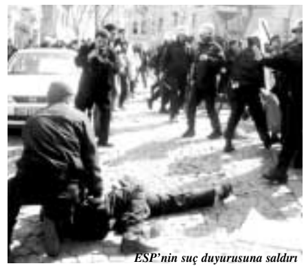
ESP'nin suç duyurusuna saldırı

Mart ayı başlarından itibaren yoğunlaşan devlet saldırı ve terörü kendini hissettirir boyutlarda gösteriyor. Düzenlenen her eylem ve etkinliğe yönelik saldırılar medyada gizlenmeksizin gösteriliyor. Artan bu baskı ve saldırılar elbette tesadüf değil. Ardarda yaşanan bu saldırıların nedeni ve zamanlaması önemli. ABD'nin önümüzdeki 50 yılın hareket programını tayin edecek planları çizmeye ve tartıştırmaya başladığı ve "model ülke" olarak belirlediği ülkemizdeki bu