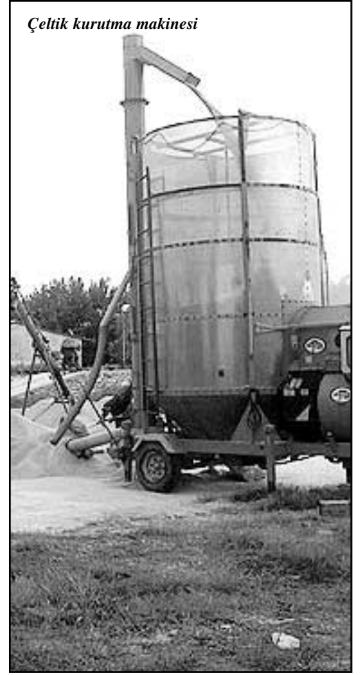
Çeltik kurutma makinesi