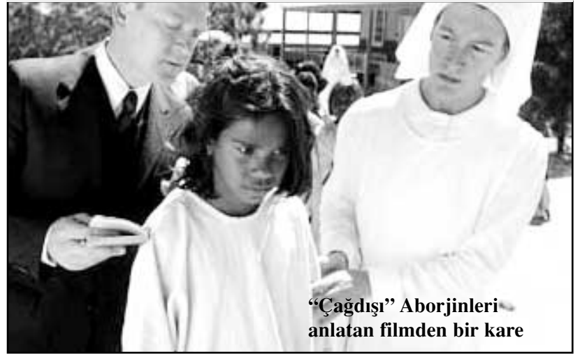
"Çağdışı" Aborjinleri anlatan filmde bir kare

Avustralya'nın Sydney kentinde polislin geçtiğimiz ay 17 yaşındaki bir Aborjin gencin ölümüne sebep olmasından sonra yaşanan olaylar nedeniyle tutuklananların sayısı 60'ı aşarken, Sydney'de yaşayan yüzlerce Aborjin, 25 Mart günü hükümeti protesto etti.