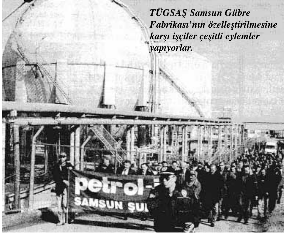
TÜGSAŞ Samsun Gübre Fabrikası'nın özelleştirilmesine karşı işçiler çeşitli eylemler yapıyorlar.

Ülkemiz toprakları Azot (N) ve Fosfor (P) gibi bitki besin maddelerince fakir olup, Potasyum (K), Kalsiyum (Ca) ve Magnezyum (Mg) gibi besin maddelerince