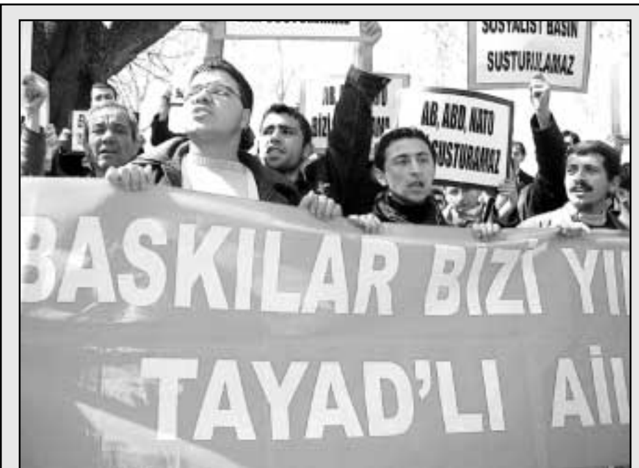
AB Enformasyon Merkezi önünde yapılan eylemde "Devrimci ve sosyalist basın susturulamaz" sloganları yankılandı.

Operasyonların olduğu birçok ilde de protesto eylemleri yapıldı.