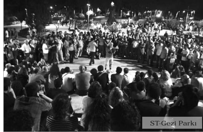
Taksim İsyanının ardından başta İstanbul olmak üzere birçok bölgede forumlar gerçekleştirilerek direniş ruhu yaşatılıyor.

nin ardından Hukuk Atölyesinin bileşeni olan avukatlar tarafından haklar üzerine bilgilendirme yapıldı.