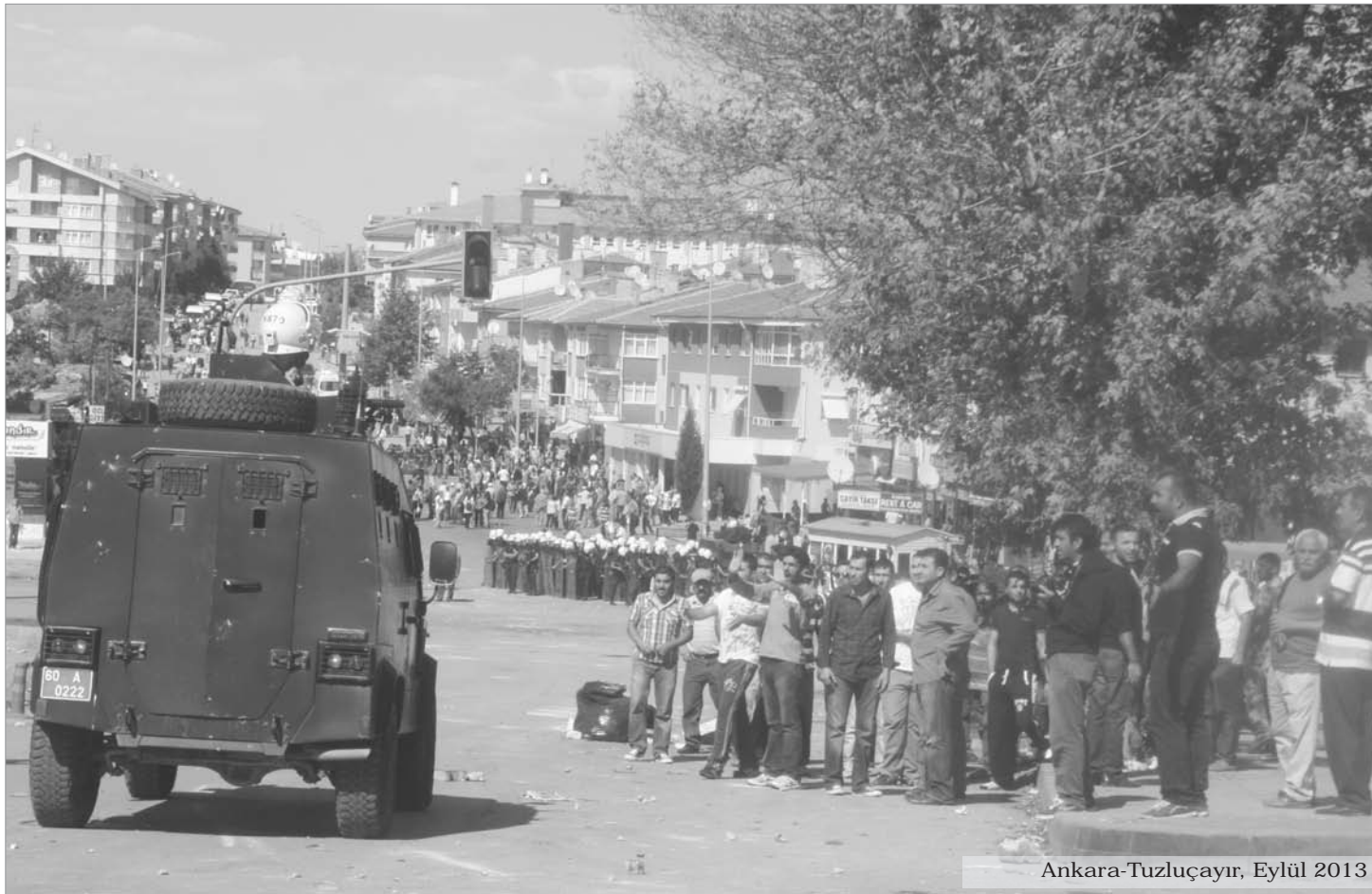
Ankara-Tuzlucaayır, Eylül 2013

T. Kürdistanı'nda PKK'nin çekilmeye başlamasıyla hızla yeni karakol yapımlarına başlayan TC devleti, bu politikasını Gezi Ayaklanması'nın ardından direnişin önemli merkezlerine yönelik süreklileşen polis ablukası ya da buralara da yeni karakollar yaparak sürdürüyor. Tuzlucaayır'da cami-cemevi inşaatını "koruyan" polis barikatı, Gülsuyu'nda çetelerin güvenliğini sağlayan yeni karakollara, üniversitelerde kalıcı polis birimlerine dönüşüyor. Tüm bunlar ölü toprağı üzerinden atan halktan duydukları korkuyu gizledikleri, yıkılan korku imparatorluğunu "yeniden inşa etme" çabalarıdır.