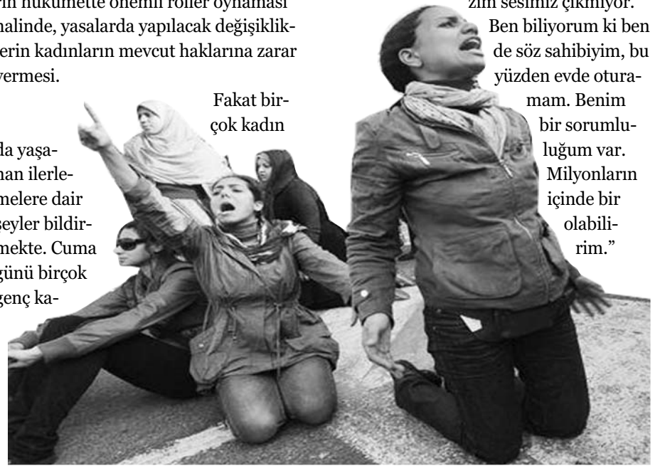
Fakat birçok kadın

Ben biliyorum ki ben de söz sahibiyim, bu yüzden evde oturamam. Benim bir sorumluluğum var. Milyonların içinde bir olabiliyim."