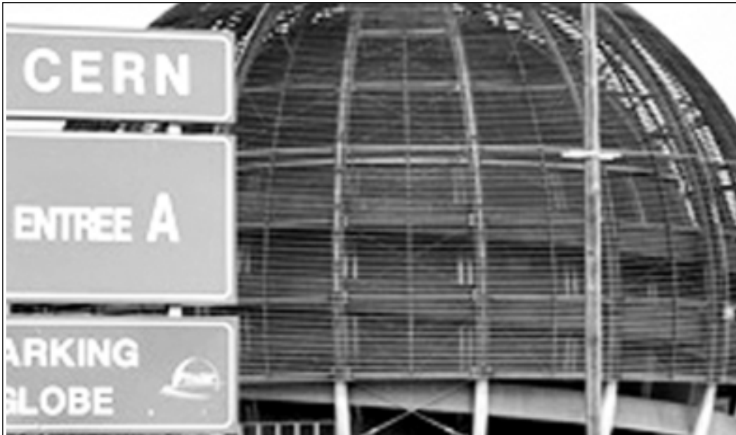
10 Eylül 2008 tarihinde, İsviçre-Fransa sınırında bulunan, Avrupa Çekirdek Araştırmaları Merkezi'nde (CERN) önemli bir deneyin startı verildi.

Sınıflı toplumlar tarihi boyunca, doğa bilimlerindeki gelişmeler, sınıf savaşımına dolaysız yansımıştır. Kapitalist topluma kadar, din ile felsefenin ve din ile devletin özdeş olmaları, doğa bilimlerini de kı-