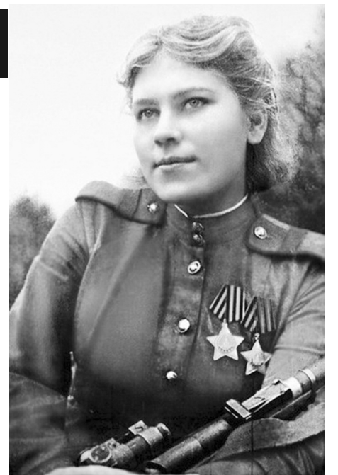
* Bu yazı atexnos.gr internet sitesinden çevrilmiştir.

1945 Ocak'ın 27'sinde Rosa, kendi bölüğünün yaralı bir subayını korumaya çalıştığı esnada el bombası şarapneliyle, karın bölgesinden ağır yaralandı ve ertesi gün hayatını kaybetti. Kısa yaşamında Sovyet halkının değerli kahramanı ve faşistlerin korkusu oldu. "Doğu Prusya'nın görünmez korkusu" (ona böyle diyorlardı) 59 Hitler askerini öldürmeyi başardı. Ölümünden sonra da onurlandırılmaya devam edildi. Özgür yaşamaları için hayatını feda ettiği yeni nesillerin onu hatırlaması adına, köyünde bir müze inşa edildi. 16 Ocak'ta, çatışmaların durduğu bir esnada günlüğüne şunları yazmıştı: "Benim yaptıklarım, tüm Sovyet halkının ana vatani savunmak için yaptıklarından daha fazla değil."