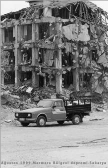
Ağustos 1999-Marmara Bölgesi depremi-Sakarya

Yapılan araştırmada birçok AVM'nin, Rezidans'ın, futbol sahalarının, TOKİ'ye ait konutların yapımı ile kentsel rantta dönüştürülen afet toplanma yerleri olası bir depremde yaşanacak faciyanın boyutlarını da artıracaktır.