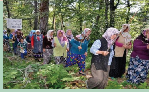
ruması altındadır, ağaçlarımızı kimse kesemez" pankartı asan köylüler, "2

değil, 4 değil, 5 değil, 300 değil, 2 bin 453 ağaç kesilecek", "Su yerine zehir içmek istemiyoruz", "Cennet köyümüzü cehenneme çevirmeye izin vermeyeceğiz" yazılı dövizler taşıdı. Orman Bölge Müdürlüğü yetkilileri ise söz konusu alanın maden izin sahası içerisinde olduğunu ve şirketin işyeri açmak için ruhsat aldığını, ağaç kesiminin yasal olduğunu söyledi.