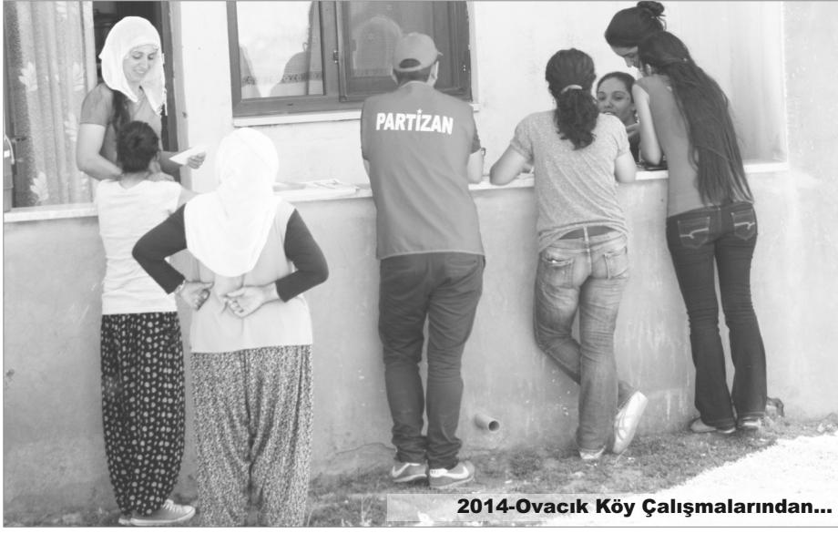
2014-Ovacık Köy Çalışmalarından...

Cumhurbaşkanlığı seçimlerine ilişkin boykot tutumumuzu açıkladık. Tutum belgemizin açıklanmasından sonra, bu doğrultuda gerçekleştirilen pratik çalışmalar da bulunuyor. Nitekim bu çalışmalardan biri de Antakya'da Evvel Temmuz Festivali vesilesiyle Samandağ Sutaş Beldesi'nde gerçekleştirilen köy çalışması ve bu çalışmada kitlelere Cumhurbaşkanlığı seçimlerinde boykot tavrımızın anlatılması olmuştur. Bu çalışmada dikkat çeken, yoldaşlarımızın halkın boykot tavrını sahiplenmelerine şaşırmaları olmuştur. Eğer gidilen kitlenin boykot tavrını olumlaması ayaküstü/geçişirmeci ve daha da önemlisi Demirtaş'ın adaylığına yönelik sosyal şoven bir yaklaşımın ürünü değilse, kuşkusuz çok önemlidir.