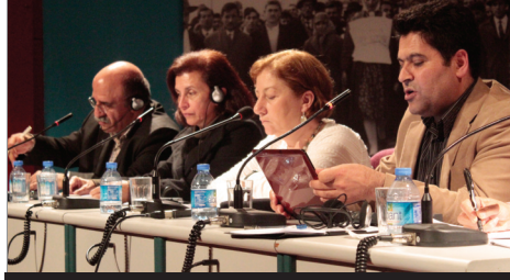
Brezilya hapishaneleri üzerine Brezilya Halkla Dayanışma Merkezi ile söyleşi/SAYFA 13

savunucuları ve hukukçuların katıldığı sempozyumda tecrit-tretman saldırılarından kadın, LGBTİ, çocuk hapishanelerinde yaşananlara kadar bir dizi konu üzerine konuşuldu. Uluslararası bir dayanışma ağı oluşturulması üzerine de tartışmalar yapıldı.