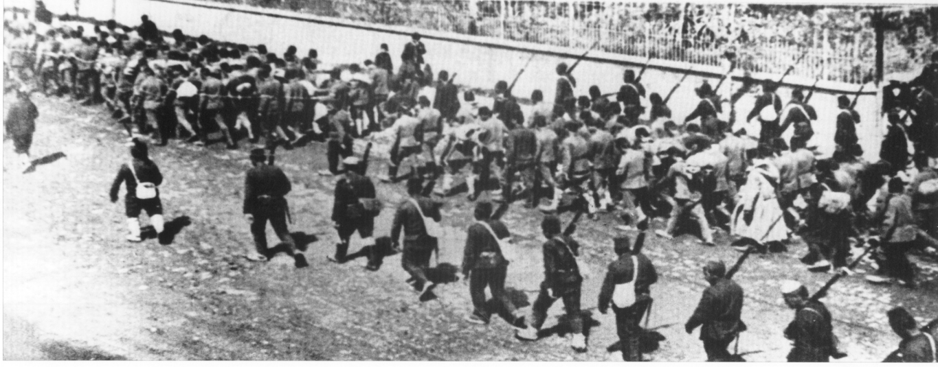
ՀԱՅԵՐԻ ՉԵՆԳՎԱԾԱՅԻՆ ՏԵՂԱՀԱՆՈՒԹՅՈՒՆԸ ԹՈՒՐԿ ՁՐՆՎՈՐՆԵՐԻ ՈՒՂԵԿՅՈՒԹՅԱՄԸ МАССОВАЯ ДЕПОРТАЦИЯ АРМЯН ПОД КОНВОЕМ ТУРЕЦКИХ СОЛДАТ