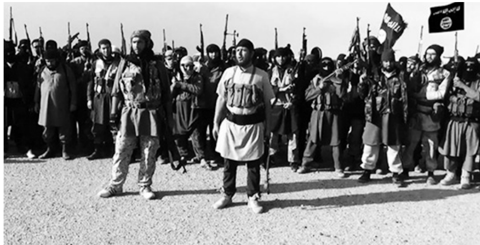
Kocaeli'den bir YDG'li

IŞİD diğer radikal İslamcı örgütlere göre yerelde kurumsallaşmaya daha çok önem vermektedir. Ele geçirilen yerlerde yapılan kurumsallaşma sadece askeri alanda sınırlı kalmamış günlük yaşamı kontrol eden ve "düzenleyen" uygulamalara giderek bölgeyi hilafete göre şekillendirmektedir. Şehir, kasaba ve köylerde uygulanan kurumsallaşma IŞİD'in bir hilafet devleti kurma amacının ön ayaklarıdır sadece. IŞİD, girdiği yerlerde otoriteyi sağlamak amacıyla kanlı katliamlar yapmakta, insanları kaçırmakta ve işkence etmektedir. Ele geçirilen yerlerde yapılan vahşice yöntemler IŞİD'e biat edilmesini sağlayarak insanları kendisine bağlamaktadır. IŞİD'in hızlıca büyümesinin sebebi; emperyalist devletlerin silah, istihbarat ve çeşitli lojistik destekleri olmuştur. Ancak IŞİD'i var eden ve devam ettiren sadece bu olgu değildir. IŞİD'in kurumsallaştığı, var olduğu yerlerde büyümesinin diğer ayağı Esad rejimi ve Saddam sonrası köşeye itilen Sünni Arapların desteklemesinden kaynaklıdır. Toplumsal iş bölümünü gören, somut olarak ayakları yere basan IŞİD'e emperyalistlerin desteğini "kesmesi" bu işin bittiğini göstermemektedir.