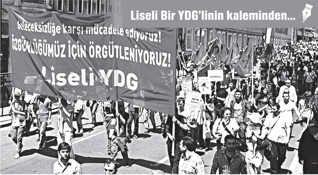
Liseli Bir YDG'linin kaleminden...

H alk gençliğinin en dinamik katmanlarından biri de liseli gençliktir. Onun bu dinamizmi, gelecekle kurduğu ilişki egemenlerin üzerlerinde "laboratuvar kurarak" gerici politikalarını uygulamasını, onu kendi varlığının sigortası olarak ikame etmesini beraberinde getirmiştir.