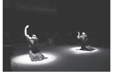
Mezopotamya Dans - 4Kapı 40Makam