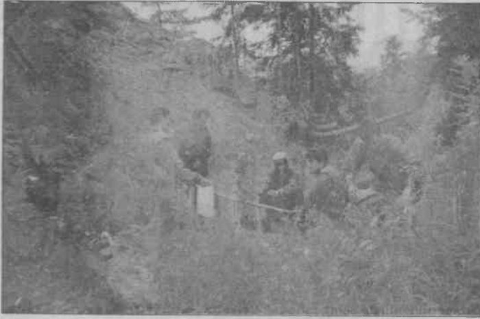
Şavşat TİKKO gerilla birliği Şavşat ormanlarında bir dinlenme anında

Artvin-Şavşat gerilla bölgesi, düşmanın "bittiler, bir avuç kaldılar" dedikleri ve diğer devrimci teşkilatların "Dersim'de sıkışıp kaldılar" dedikleri bir aşamada, yeni yeni Dersim'ler yaratma perspektifiyle, Türkiye proletaryasının ve çeşitli milliyetlerden tüm emekçilerin komünist önderi İbrahim KAYPAKKAYA'nın çizmiş olduğu kızıl güzergahta ilerleyen partimiz TKP/ML ve halk ordumuz TİKKO '90 Nisan'da Tokat-Sivas bölgesinin yanı sıra Artvin bölgesine de gerilla birlikleri çıkartmıştır ve böylece dost, düşmana sınıf mücadelesinde ulaşmış olduğumuz aşamayı göstermiştir. Bu alanlarda, gerillaların faaliyet yürütmesinin göstermelik bir olay olmadığını, bu alanlardaki TİKKO gerillalarının düşmanla bir dizi çarpışmaları ve şehitlerimiz göstermiştir. '91 Nisan'ından bu yana Karadeniz Bölgesi TİKKO gerillaları ile düşman güçleri arasında kanlı çatışmalara sahne olmuştur. Düşmanın canlı ve cansız hedeflerine bir dizi saldırılar düzenlenmiştir. Düşmana ağır kayıplar vermiştir. Bu yaşanan kanlı çarpışmalar TKP/ML-TİKKO gerillalarını hiçbir zaman yil-