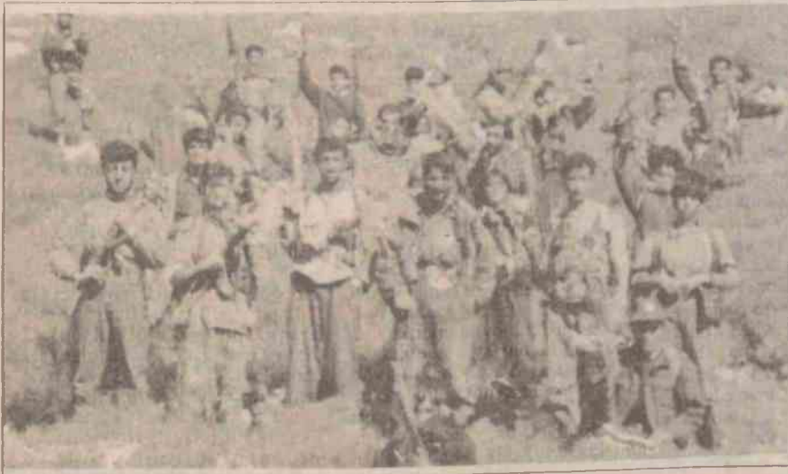
TIKKO'nun geliştirdiği gerilla mücadelesi egemenleri zora koşuyor.