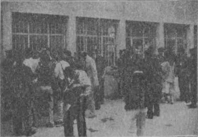
Egemenler cezaevlerindeki devrimci tutsakların mücadele ve direnişini boğmak için her yolu deniyor.

Gebze Özel Tip Cezaevi'ndeki devrimci tutsaklar bugün için durdurulan sevklerin tekrar gündeme gelebileceğini, keyfi ve kanunsuz uygulamalara karşı ellerindeki olanakların tümünü kullanarak direneceklerini, hiçbir koşulda hak gasplarına karşı boyun eğmeyeceklerini belirtiyorlar.