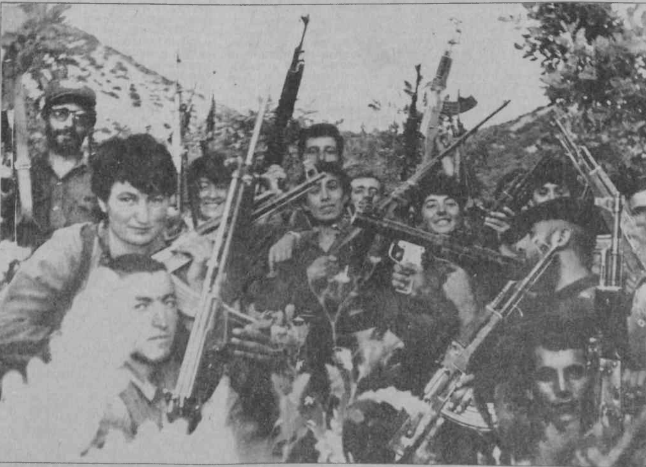
K.S.İ.'lar için Köylü Gerilla Savaşı veren TIKKO gerilla birliklerinden biri.

Uzun yıllar verilen mücadele sonucunda partimiz kitleleşti. Bu kitleleşmenin yanı sıra askeri kanatta da nicel ve nitel birim kimler oldu. Güçler onbinleri aştı, hatta bu sene ki hedef otuzbin-elli bin gibi bir silahlı gerilla ordusu yaratmak. Bunun için, dönem dönem giderek askeri örgütlenme belli bir hiyerarşik yapıya kavuşmaktadır. Bunun doğal sonucu olarak da önceden diyelim oranda takım, bölük, ve geldiğimiz düzey ise artık güçlerimiz büyüdüğü için tabur örgütlenmesidir ve giderek bunun savaş boyu-