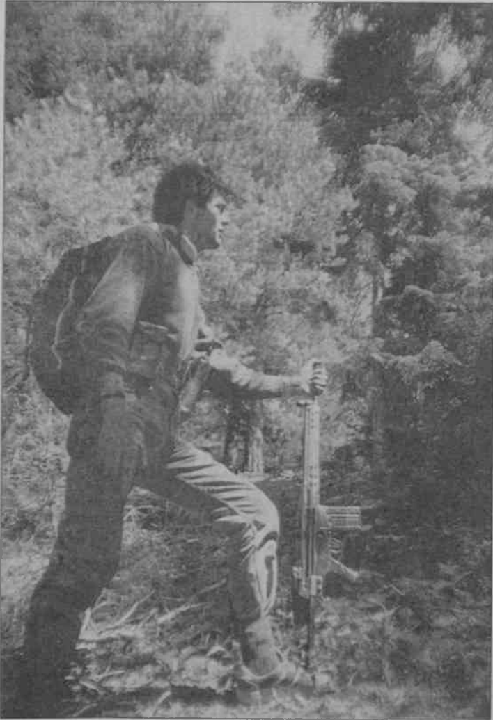
"Biz Halk Savaşı Stratejisi'nin doğruluğunu yaşayarak gördük."

Bildiriye "Siz Alevi olamazsınız" notu da ayrıca düşülmüştür.