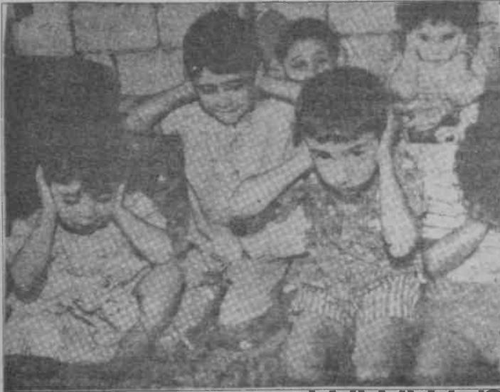
Lübnanlı çocuklar İsrail savaş uçaklarının sesini duymak istemiyorlar.

Bölgedeki tüm devletler gerici devletlerdir. Çıkabilecek savaş, gerici bir savaş olacaktır. Senaryonun TC bölümü eksiktir. Ama bir ABD üst düzey yetkilisinin "barış görüşmeleri"ne ilişkin Türkiye ziyaretiyle senaryo tamamlanacaktır.