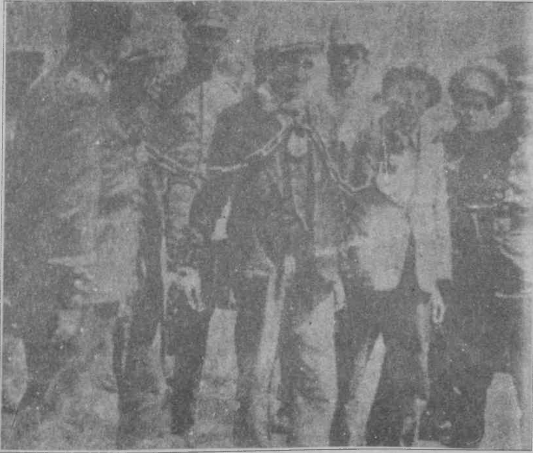
Dersim'de zulme ve esarete karşı koyanlardır zincire vurulanlar.

Çardağın yan duvarına kadar geldim. Kafamı uzatıp çardağa