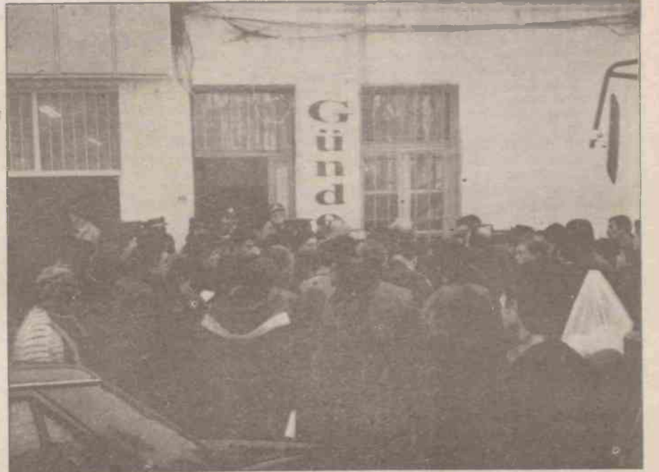
TC'nin faşist terörü, ancak, mücadeleyi çelikleştirir!..