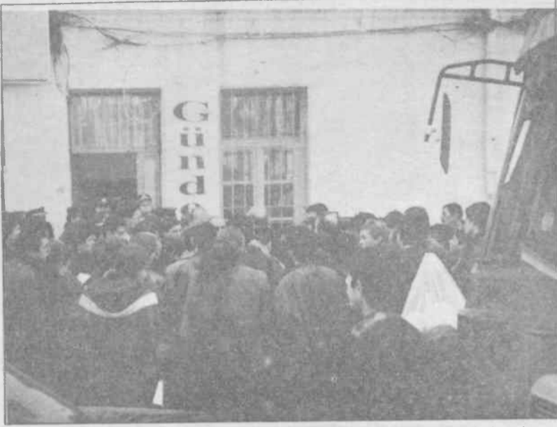
Faşist TC'nin Özgür Gündem'e estirdiği teröre karşı dostları sessiz kalmadı.

toplantılmasına, yüzlerce dava açılmasına, işkence, tutuklama, para cezası vb. lerine rağmen kır çiçeklerinin inatçılığıyla yeniden yeşeriyor, boy atıyor. Ya bu su sızan boşlukları da kapatacaklar ya da demokrasi oyununa devam