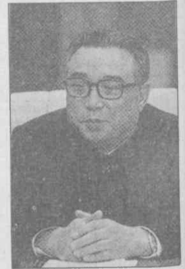
Kuzey Kore'nin revizyonist başkanı Kim Il Sung

Bu teoriye dikkat edilirse, Avrupa ülkelerinde ve sömürge/yarı sömürgelerde iktidarda bulunan sınıflar hakkında (Emperyalist sınıflar mıdır? Komprador sınıflar mıdır? Proletarya mıdır? Halktan sınıflar mıdır?) belirlemeler yoktur. Dolayısıyla, diyelim bir sömürge ülkede iktidarda bulunan sınıflar komprador olsa bile desteklenmelidir.