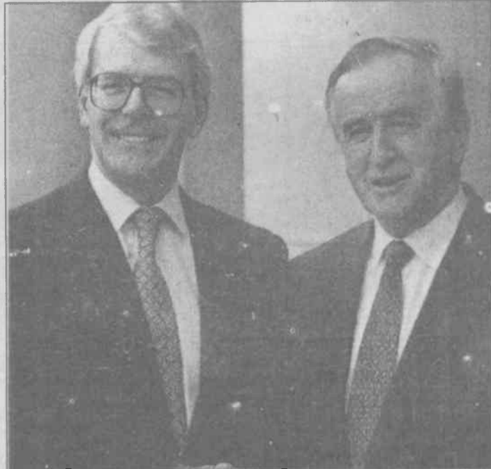
İngiltere Başbakanı Major (solda) ve İrlanda Başbakanı Reynolds (sağda) duruşmadan memnundur.

İngiliz kapitalizminin en yüksek aşamasına, emperyalizme evrilmesiyle Kuzey İrlanda yarı sömürge-kapitalist bir ülke oldu. 2. Emperyalist paylaşım savaşının öngününde, 1913'te kurulan IRA, savaşın sona 1919 yılında ulusal bağımsızlıkçı, anti-emperyalist bir programla savaşmaya başladı. İngiliz emperyalistleri, iki yıllık savaşın sona, Britanya İmparatorluğu içerisinde kültürel özerkliğe sahip bir serbest İrlanda Cumhuriyeti devleti kurulmasına "izin" verdiler. Aslında bu, silahlı mücadelenin sekteye uğratılması için verilmiş küçük bir yemdi. Nitekim, IRA içerisindeki uzlaşmacılarla radikaller arasında 1922-23 yılları arasındaki 1 yıllık iç savaş radikallerin yenilgiyle sonuçlandı. Radikaller yeniden toparlanarak silahlı mücadeleyi sürdürdüler. IRA, bir kez 1931'de, sonra bir kez daha 1936'da yasadışı ilan edildi ve o gün bugündür silahlı mücadeleden ödün vermemiş illegal bir yapı olarak tanınırdı.