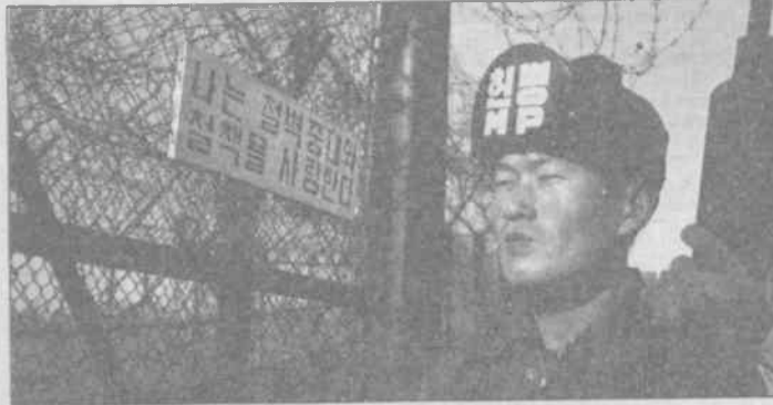
Kuzey-Güney sınırı. Durum oldukça gergin ve Güney Kore'li asker tetikte nöbet tutuyor.

Gerici medya da tetiklenerek devreye sokuldu. Newsweek'e göre, Kuzey Kore'yi 45 yıldır yöneten Devlet Başkanı Kim Il Sung'un diktatörce yönetiminin izleri, başkent Pyongyang'ın sokaklarında