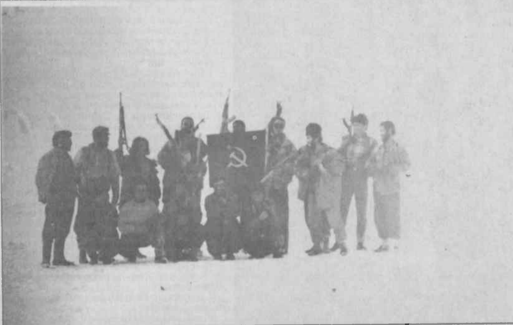
TİKKO birliği öğleden sonra kar yağışıyla birlikte üç grup halinde eyleme yöneldi.