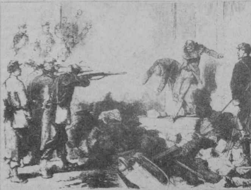
Komuncular, yakalandıkları veya teslim oldukları yerde hemen kurşuna diziliyordu

Türkiye'de sivil faşist hareketin lideri olan Alpaslan Türkeş, Milli Birlik Komitesi'nin sözcüsü olarak Türkiye Radyoları'ndan yaptığı, darbenin amacını ve niteliğini açıkladığı konuşmasında 27 Mayıs'ın emperyalizme uşaklık konusundaki sadakatini: "Bütün ittifaklarımıza ve taahhütlerimize sadıkız. NATO'ya ve CEN-TO'ya inanıyoruz" sözleriyle vurguluyordu.