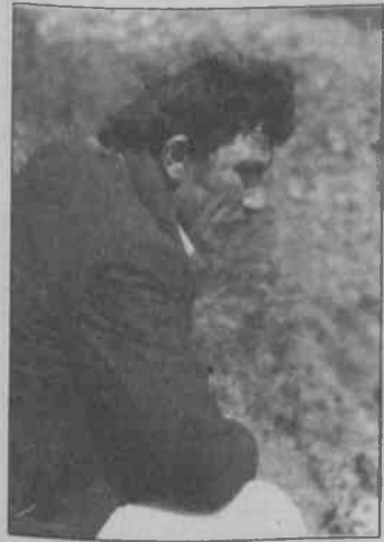
Ablası, eniştesi ve dört yeğeni bu facianın kurbanları. Umudu canlı çıkmalarından yana değil artık...