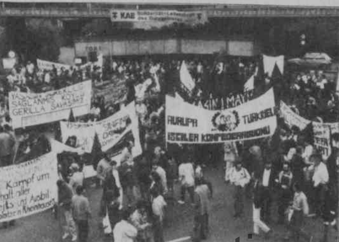
Berlin meydanı, Kroyzberg'te 1 Mayıs'a girmek için.

Bu işçiler için bir engeldir, örneğin, işverenler arada sırada fiyat artışları, iyice artırılmış iş hızı ve daha başka tedbirler alırlar. İşverenler bu tedbirleri, üretim araçlarının emirleri altında bulunmalarından dolayı her zaman yapabilirler. Tabii ki bu sırada işçiler yasalara engel olmamak zorundadırlar. Tekel bantlarını kendilerine ait yasalarına karşı koruyorlar. Ki bu, işçi düşmanlığı belirlemelerini savunmalarına bir neden değildir. Ekonomik istemler politik arena, çokça ve eksiksiz olarak dile getirilmeli; yasal grev hakkı kazanılmalıdır.