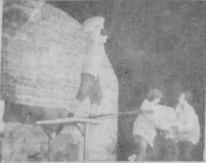
Gorki'nin "Ekmek İşçileri" yapıtından bir sahne.

Miodrag Bulatoviç'in "Godot Geldi" ve İsmet Kuntay'ın "403 Kilometre" adlı oyunlar buradaki provalar sonucu yaratılıyor.