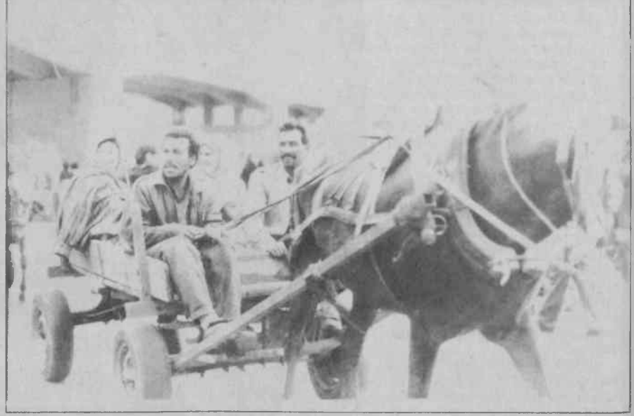
Göçebe çingenelerin tek sermayesi atarabası. Kakava bayramında naylon, kağıt, tenekeler toplamayı bırakıp atarabalarının arkasına doluşurlar. O gün Şeytan Deresi'nde yıkanıp günahlarından arınırlar.

Çadırcılar dereye kurbağa avına çıkıp salyangaz toplarlar. Kırklareli'nin kenar mahallerinden biri olan Yayla'da yaşayan fakirler için naylon, tenekeler, demir toplama, kalaycı-