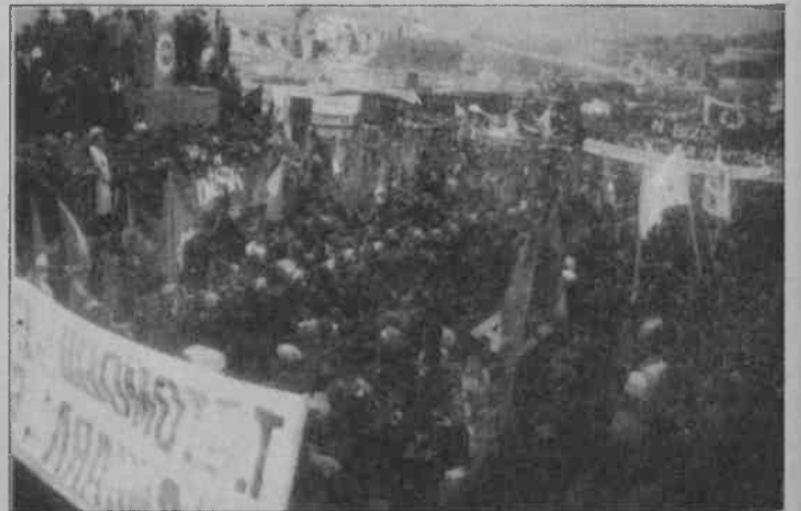
Kamu sendikalarının DİSK'in yanında yer alması eleştiriliyor.

Miting bitiminde bazı gruplar Taksim 1 Mayıs Alanı'na gidilmesi için sloganlar atıldılar. TKP-ML,