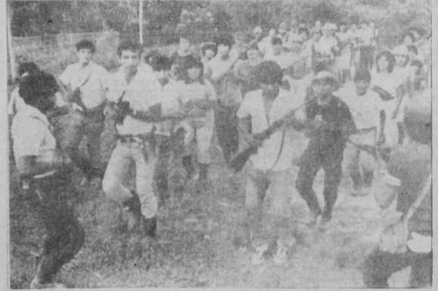
Peru'lu gençler, PKP önderliğinde iktidara yürüyor

PKP, burjuvazinin hiçbir zaman daha gelişkinine ulaşamayacağı halk savaşı stratejisi avantajını da iyi değerlendirerek başlattığı silahlı mücadelesi, Peru'daki diktatörlük tarafından kanla boğmak istendi; bunun için çalışıldı, çalışılıyor.