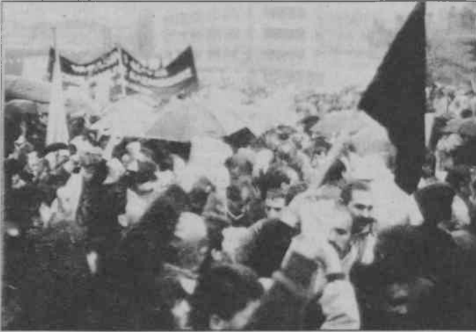
Onlar Selda'yı dinletirken işçiler 1 Mayıs'ı söylüyordu.

1 Mayıs sabahı İstanbul'da Şişli-Çağlayan Abide-i Hürriyet Meydanı'na doğru akan onbinlerce işçiyi ilk önce sivil ve resmi polisler karşıladı. Anadolu'dan gelen işçi otobüslerinden inen işçiler erken saatlerde Darülaceze, PERPA binası ve Abide-i Hürriyet kavşağında birikmeye başladılar. Sloganlarla Abide-i Hürriyet Meydanı'na doğru süren yürüyüşler yaklaşık bir saati buldu. Türk-İş Konfederasyonu üyesi sendikaların alanda yerleşmeleri çok uzun zaman aldı. Sabah başlayan yağmuru aralıksız yağması da olumsuz rol oynadı. Pankartlar ıslandı. Karton dövizlerin bir kısmı eridi. Pankart boyaları aktı. "İliklere kadar ıslanmamak" isteyen işçiler naylonlara büründüler. Bazı işçiler naylon "giysiler"le garip bir şekle büründüler.