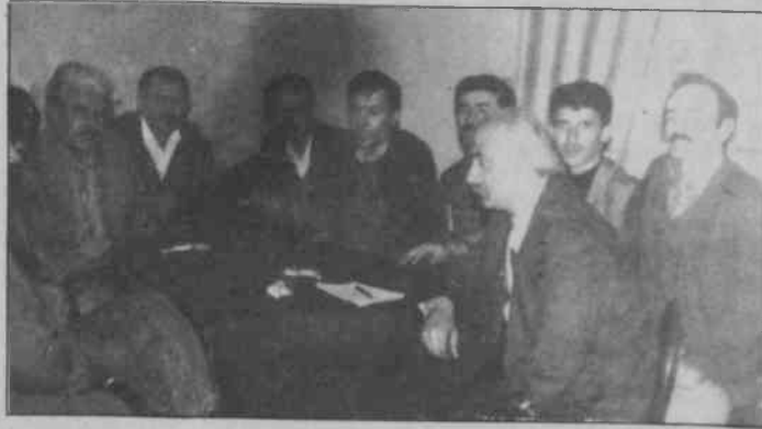
İşverenin sıfır teklifini kabul etmeyerek greve çıkan İstanbul Cam işçileri ardından Şişecam grubuna bağlı 10 işyerinde 10 Mayıs'ta grev kararı alındı.

26 Nisan'da bir toplu sözleşme görüşmesi daha gerçekleşti. Fakat yine değişen birşey olmadı. Çünkü işverenin son teklifi 6 ay sıfır zam ve 6 ay sonrası içinde yüzde otuzluk zam önerisiydi. Artık işçiler için ok yaydan çıkmış oluyordu. 27 Nisan'da üretim silahlarını kullanmaya karar verdiler ve greve çıktılar. Greve, Petrol-İş Topkapı Şubesi üyesi işçilerle, Paşabahçe Şiş Cam Fabrikası işçileri destek veriyorlar.