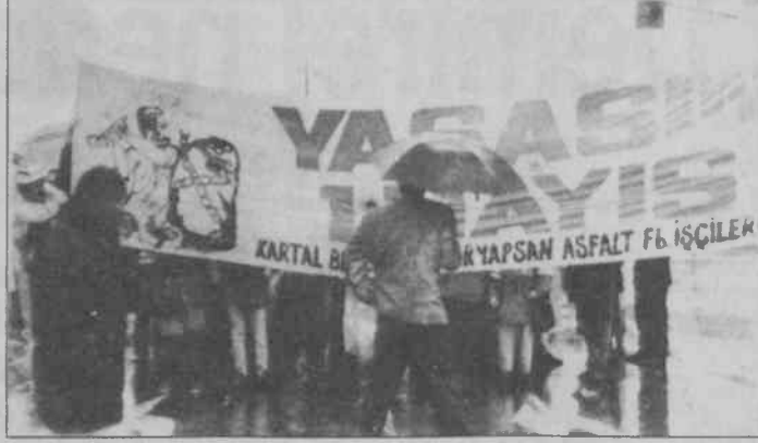
Haklı ve güzel günlere yürüdüler

Türk-İş üyesi 32 sendika, kortajlar halinde tek tek alana girerken son derece arabesek bir üslupla işçilerin gelişini selamlayan bu şahıs maçı anlatır gibiydi. 1 Mayıs'ı "Bayram" havasına dönüştürmek için özel olarak görevlendirilmişti. Ancak onun sesini devrimci sosyalist