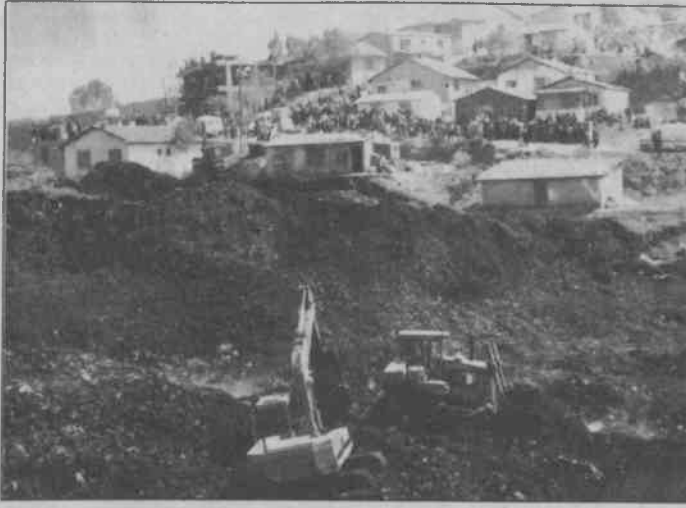
Dünyada eşine rastlanmamış bu faciayı görmek için, akın akın insanlar geliyordu.

Burjuva basını, bu olayı manşetlere çıkarıp suçluları yargılamaya başladı. Toprağın altına diri diri annesini, babasını, kızını, oğlunu