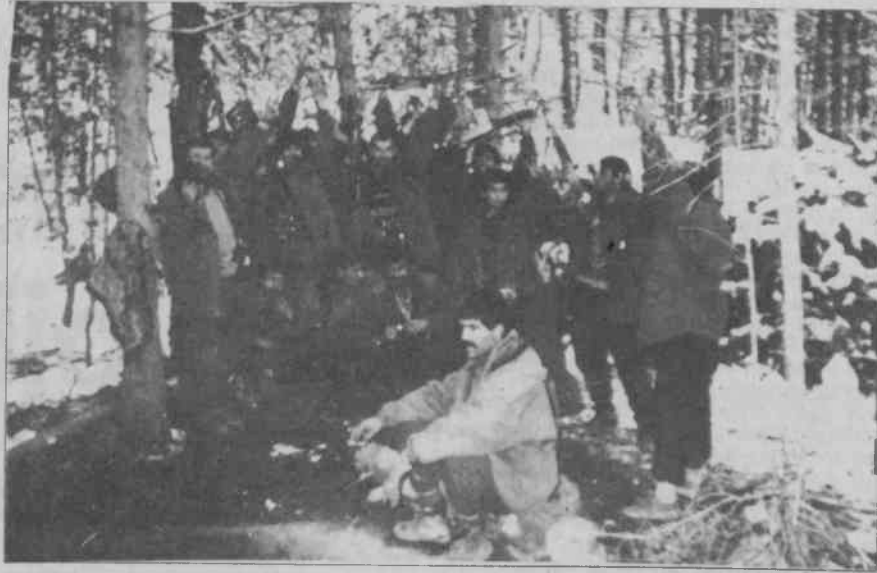
"Karadeniz'de diğer grupların faaliyetleri gerilla savaşı perspektifleri olmadığı için başarısız kalmıştır"

— Bizim bölgeyi terketmemiz kesinlikle söz konusu değil. Devletin bu yalancı da çaresizliğinden kaynaklanmaktadır. Kış koşullarından dolayı faaliyetin durması bölgeyi terkettiğimiz anlamına gelmez. Gördüğümüz gibi bölgedeyiz. Bölgede barınmanızda halkın desteğini inkar edemeyiz. Sizin de söylediğiniz gibi Başkan Mao'nun bu sözü bizim için de geçerli. Halkın desteği olmasaydı sudan çıkmış balığa dönerdik. Yaz dönemi devletin çok yönlü saldırılarına ve propagandasına rağmen halkla kaynaştık. Bunun sonucunda halkın desteğiyle bölgede barındık. Halk bugün TİKKO'yu sahipleniyor, bizi umudu olarak görüyor.