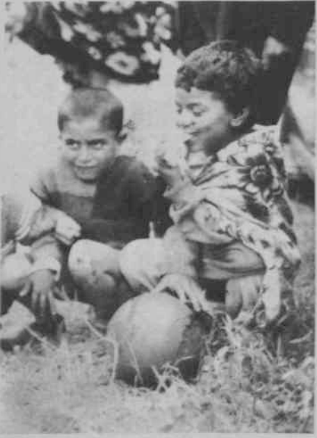
Yerliler onlara "Şopar", onlar da yerlilere "gace" der

Devlet yoksuldan korkar. Kakava Şeytanderesi kıyılarında iki otobüs polis bekler. "Kavga çıkmasın" diye. Sonra "şüpheli şahısların kimliklerine bakılır.