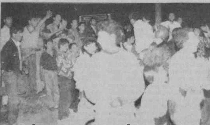
Asarlık köylüleri 23 Nisan'da İzmir-Çanakkale yolunda eylem yaptılar.

Konuştüğümüz Asarlık köylüleri "kendiliğinden gelişen oturma eylemini burjuva basının çarpıtarak, provakator bir üslupla vermesin" çok kızıyorlar. Devletin Kürt oldukları için kendilerine potansiyel suçlu muamelesi yaptığını düşünüyorlar. Menemen Kaymaka-