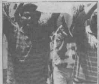
1 günlük uyarı eylemlerinden

Deri-İş sendikası Tuzla Şubesi'nden bir temsilci de işçi sınıfının çeşitli sorunlarla karşı karşıya kaldığını söylüyor ve bu sorunların uluslararası sermaye ve onların yerli işbirlikçilerinin emperyalist saldırılarından kaynaklandığını