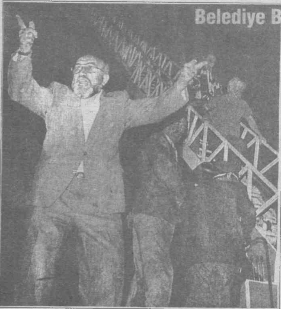
Egemenlerin "gerekeni yaptık" dedikleri otelde mahsur kalan insanlar kurtarmak için gelen itfaiyenin merdivenlerini otelden uzatışını gösteren bir fotoğraf.

Planlar buna göre, bu doğrultuda yapıldı. Sonuç can almayla, kan akıtmayla bitirse ideal olacak, ancak en kötü so-