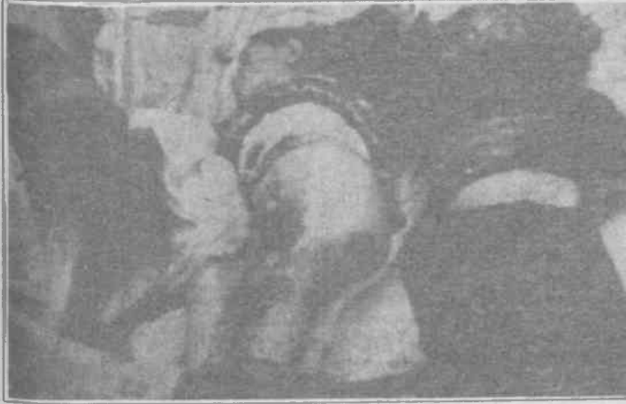
Kontrgerilla Sündüz Yaylası'nda acımasızca çocuklar ve kadınlarından oluşan 23 kişiyi katletti

DEP Diyarbakır Milletvekili Hatip Dicle katliamla ilgili yaptığı bir basın açıklamasında "Olayın kontrgerilla tarafından yapıldığına inanıyoruz. Kontrgerilla, PKK'ya karşı psikolojik üstünlük sağlamak için bu tür katliamlara yöneliyor. PKK'nın terörist bir yapı olduğunu kanıtlamaya yöneliktir" diyordu.