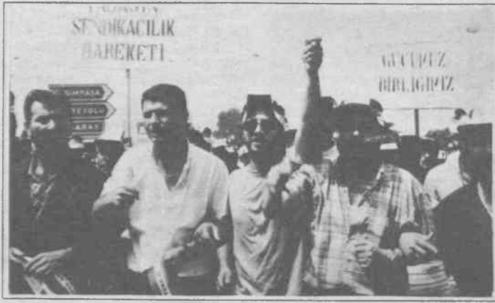
22 Temmuz'da bütün emekçiler yollardaydı.

Milli Eğitim Basımevi, Damga matbaası ve Darphane'den yaklaşık 800 işçi Sultanahmet SSK Dispanserine geldi. Onlara 120 kişilik TEK memurları da katıldı. Yürüyüşte polislin yoğun önlemler aldığı görüldü. TEK işçileri bir davulcuyla yürüyor ve davulcu sloganlara ritim tutuyordu. Kitle Eminönü Belediyesi önünden geçerken onları Tüm Bel-Sen Üyesi memurlar alkışladı. Belediye önünde toplanan memurlar ve işçiler birbirleriyle "sloganlaşarak" selamlaştılar. İşçilerin en çok attığı slogan genel greve ilişkin sloganlardı. Sloganlar