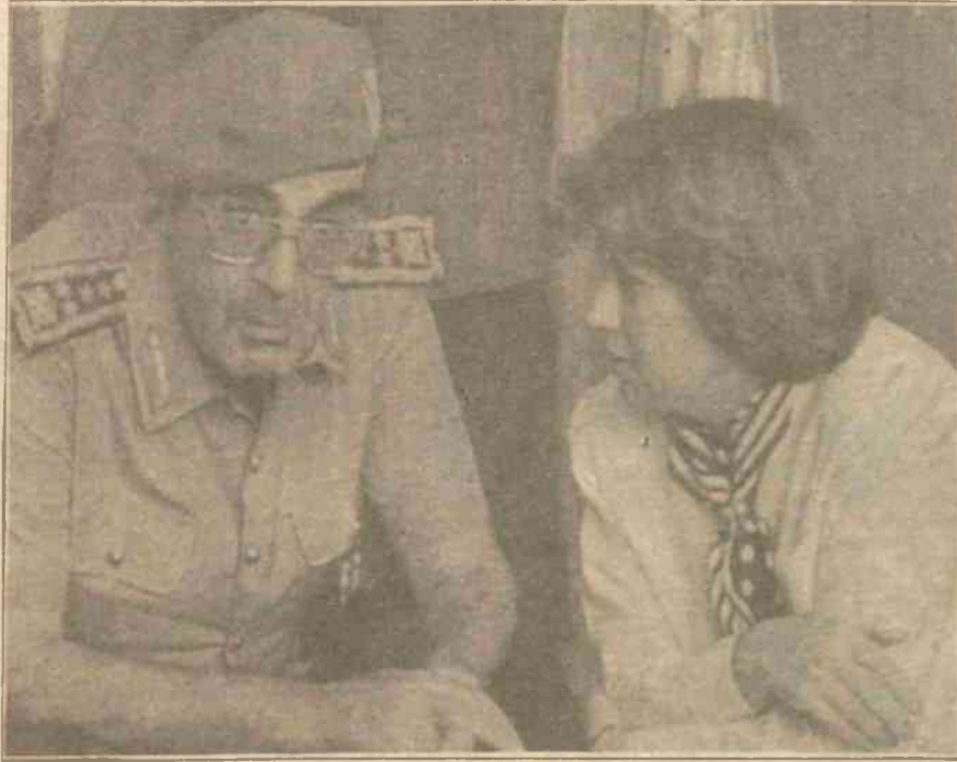
3. Sayfa "Asker sivil elele topyekün savaş sendromuna"

■ 70 yıllık soykırımcı, politikaya rağmen, Dersim, Botan vb. bölgeler egemenler için "çıban başı" olmaya devam ediyor. Hem de eskisinden daha güçlü ve daha bilinçli olarak. Paşaların deyimiyle "Cumhuriyetin kahredici orduları" gerilla savaşı karşısında apışıp kalmışlardır. Her geçen gün gerilla alanlarının çoğalması ve geniş halk kesimi tarafından destek görmesi onların baş çıkmazı durumundadır.