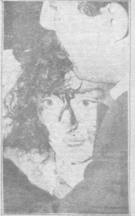
Kadın-erkek, genç-yaşlı demeden yakılarak ağır yaralanan insanların tedavileri dahi engellendi.

Çünkü en beylik deyimiyse bu bir devlet politikasıydı ve benzer durumlarda verilecek demec ve emirler anayasada yazılıymışçasına belliydi. Bu yüzden kimi çevrelerin yaptığı gibi olayı devletten soyutlamak için bireysel suçlular (İçişleri bakanı, vali, emniyet müdürü vb.) ilan etmek bilinçli ya da bilinçsizce katliamın gerçek yüzünü gizlemeye yaramaktadır. Zaten devlet de hemen emniyet genel müdüründen Sivas emniyet müdürüne, validen belediye başkanına kadar tüm alt kademelere tripod vurarak akılsızca kendini kurtarmıştır. Sayfa suçlu A.Nesin ve katliamı uğrayanlara yüklemi-