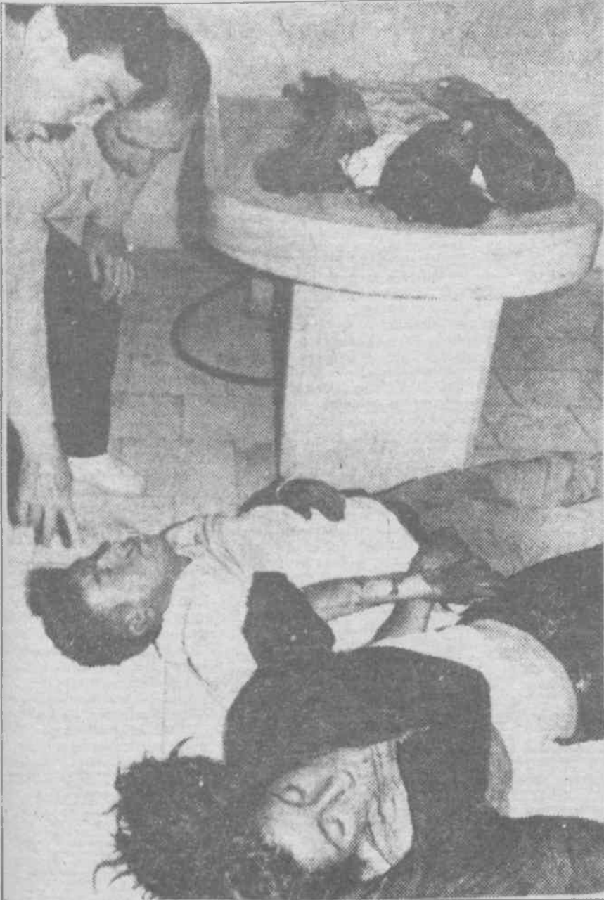
TC.'nin beslemeleri kendilerine biçilen rolleri en mükemmel biçimde oynatarak savunmasız devrimci-demokratları Sivas yangınına dümanlar haline dönüştürdü. Nitekim, hiçbir engellemeye karşılık-

Kamuoyunun belli bir kesiminde oluşan alışıl gelmiş düşünce sayılabilecek tepki yoğunluğu katliamın ilk günlerindeki yorumların ilerleyen günlerde değişmesine yol açtı. Ancak olaydan devleti sıyırmaya çalışma tavrı genel olarak değişmedi. Faşizm ile anladığı dilden mücadele etmenin karşısında olanlar ile olayı laik-anti laik, şeriat-kemalist çatışması şeklinde göstermeye çalışanlar da sonuçta bu cephenin içinde kalıyorlar. Elbette, bugün görünürde bu tip çekişme ve çelişmelerin varlığından söz etmek mümkündür ancak laikler ile anti-laiklerin, şeriatçılar ile kemalist cumhuriyetçilerin aynı soydan gelme kardeşler olduğu gerçeğini de kitlelere kavratmak, halkı doğru bilinçlendirmek durumunda-