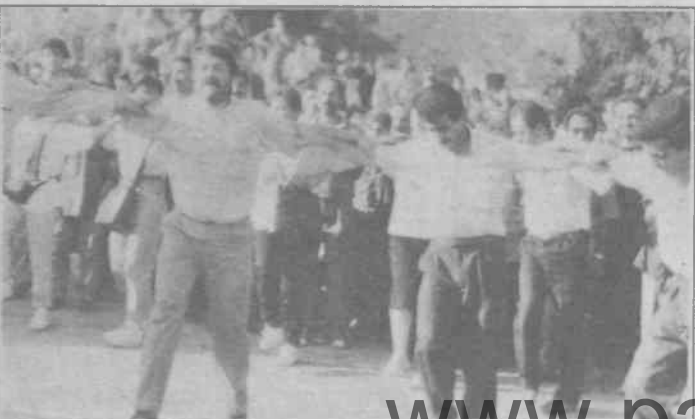
Memurlar Sultanahmet'te halayda..Mücadeleyi kanlılıkla klasik memur şajını değiştiriyorlar.

Bildiride "Zenginlerin trilyonlara varan vergi borçlarına bir çırpıda kalem çekenlerin, emekçilere yükledikleri ve memurların örgütlü gücü olan sendikaları muhatap almadıkları" vurgulandı. Bildiri şöyle notlanıyordu: "Kamu emekçileri olarak bundan sonra haklarımız alınca kadar meşru ve demokratik zeminde mücadele edeceğiz."