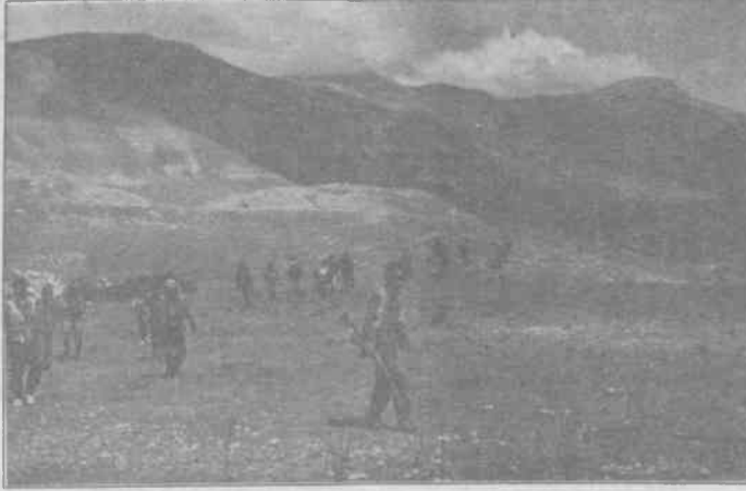
TIKKO gerillaları Dersim'de Topyekün savaşa karşı koyma yürüyüşünde.

Çemişgezek ilçesi TIKKO gerillaları tarafından basıldı. Roket ve ağır silahların kullanıldığı çatışma-