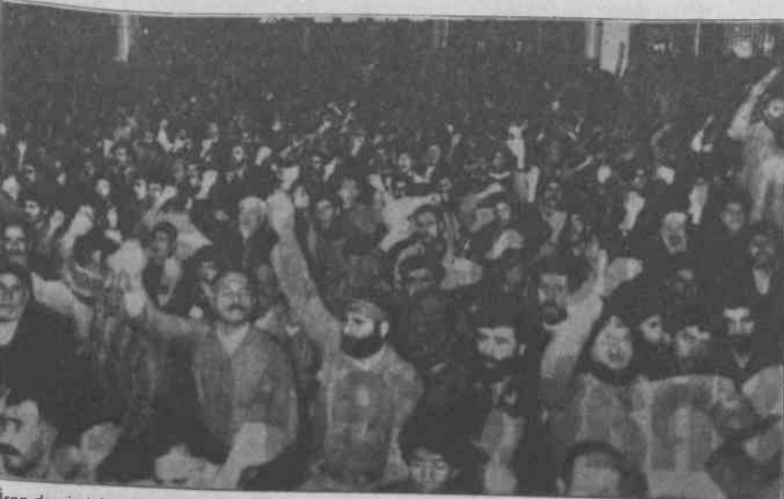
İran devriminin 15. yıldönümü kutlamalarından bir görüntü

Öte yandan yine olayla ilgili olarak ATIF, AGİF, Bolşevik Partizan (NRW), Kürdistan INFO, TKP-Kıvılcım, Dev-Genç ve İşçinin Yolu imzalı "Bu Kaçınıcı Saldırı?" başlıklı bir basın açıklaması yapıldı. Saldırıların kinandığı açıklamada, ATIF, "Yirmi yıla yakın bir geçmişe sahip olan, bünyesinde Türkiye ve T.Kürdistanlı emekçilerin barındırın, bunların ekonomik-demokratik haklarını savunan ve bu uğurda mücadele eden devrimci-empyralist bir örgüt" olarak tanımlandı.