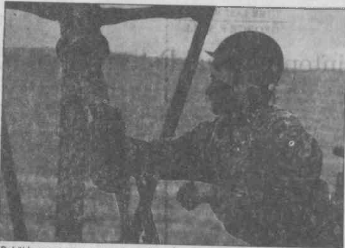
Bakü'de petrol sondajında çalışan bir işçi. Batılı emperyalistler, emekçileri "geleceğin zenginleri" demagojisiyle aldatmaya çalışıyorlar

pitalistler endişeli. Çünkü fiyatların yükselmesi ani iflasları getirebilir. Diğer bir sorun Rusya. Kazakistan petrolü, ülke kara ile çevrilmiş olduğu için borularla aktarılıyor. Ama boruların hiçbirinin rotası coğrafî ve siyasi olarak problemsiz değil.