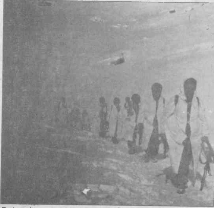
Bu kışta kuyamette Demokratik Halk İktidarını kurmak için daha bir azimle çatışıyor TIKKO gerillası

Haber Merkezi- 2 Şubat günü, Dersim'in Hozat ilçesine bağlı Uzundal (Xoşan) köyünde TIKKO gerillalarıyla devlet güçleri arasında çatışma çıktı. Çatışma sonucunda devlet güçlerinden 6 kişi ölüme, gerillalar kayıp vermeden üstlerine çekildiler. Yerel kaynakların gazetemizi arayarak verdiği bilgilere göre olay şöyle gelişti: 2 Şubat sabahı, saat 7.30 civarlarında, TIKKO gerillaları Hozat'ın Xoşan köyündeki askeri birlikle çatışmaya girdiler. Bunun üzerine TIKKO birliğiyle devlet güçleri arasında çıkan çatışma, aralıklı olarak akşam saat 16.00 civarlarına kadar sürdü. Ağır kış koşullarına ve kar kalınlığının yer yer 2 metreye yaklaşmasına rağmen çatışmayı başarı ile yürüten TIKKO gerillalarına karşı, devlet güçleri Hozat merkezinden geri tepmesiz top ve uzun menzilli toplar getirdi. Toplar TIKKO gerillalarını durdurmaya yetmeyince, karadan panzerler ve takviye birlikler eşliğinde saldırıya geçen devlet güçleri, havadan da helikopter desteğini ihmal etmediler. Ancak iyi mevzilenecek bulunan TIKKO birliği, bütün bunları etkisiz kılarak, çatışmadan başarıyla çıktı.