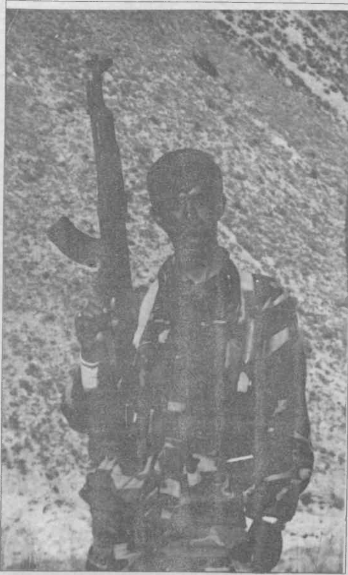
"Kahpe pusulardan usta bir partizanın kıvraklığında düşmanı alteden sen değil miydin, korkusuzum."

beni. Ardından iç geçirme yerini kır çocuklarının esmer gülüşlerinde rastladığım rahatlığa bıraktı. Sonra, senli geçen günlerin anılarda kalan güzelliğini, dudagında çok sevdiğin türkünün mırıldanmasıyla voltaya çıkarak yeniden yaşama kararı verdim. Volta ağır, volta hüzünlü, volta geçmişin senli güzelliğine bulanmış. Biliyorum korkusuzum sen hiç tanışmadın, tutsaklığımızın utancını yaşayan mapushane duvarlarıyla. Bilemezsin bizim mekanımızda yoldaşlara dair, "ölüm" haberleri nasıl düşer. Kurşun ağırlığında tutsak bedenlerimizde taşıdığımız özgürlüğün coşkulu akortunda çarpan yüreklerimizin üzerine. İşte o zaman akşam daha da "erken iner mapushaneye."