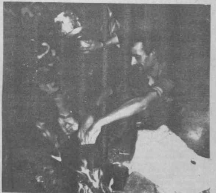
Sen o çağları partizan savaşının partizanca paylaşmanın ustasıydın"