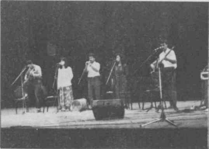
Grup Munzur ezgileriyle bir isyan ateşi.

Programına, "Değerli dostlar geçtiğimiz Ocak ayı uluslararası proletaryanın ve Türkiye proletaryasının sınıf savaşımında çok önemli bir yere sahip olan bir aydır. Uluslararası proletarya ve Türkiye proletaryası birçok ustasını, öğretmenini ve savaşısını bu ayda şehit vermiştir. Bu anlamda Türkiye proletaryası Ocak ayının son haftasını devrim şehitleri Haftası ilan ederek meşaleleştirmiştir. Bu bağlamda ey yarınınıza ışık olup karanlığı burju burju delip yarınımıza ışık olan kızıl karanfiller and olsunki zafere kadar dalgalanacak meşaleniz" sözleriyle programına başlayan Grup Munzur'u bütün kitle ayakta "Devrim Şehitleri Ölümsüzdür" sloganıyla yanıtladı. Devrim şehitlerinin anısına hazırlanan, halkımızın kurtuluş umudu gerillanın yaşamı, duygusu ve yeni gerilla adaylarının gerillaya olan özlemini dile getiren şiir otantik enstrümanların eşliğinde okundu. Kitle şiiri heyecanla dinledi. "Babanın Türküsü"nü Grup Munzur