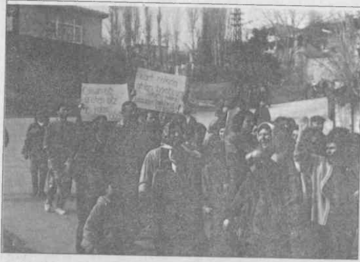
Gülsuyu halkı son zamlara isyan etti.

Gülsuyu Meydanı'nda öğleden sonra toplanıyorlar... Yaşlı, genç, çocuğu, kadını, erkeğiyle... Yaşlı bir adam konuşmaya başlıyor; "Biz Gülsuyu halkı olarak devletin baskılarını protesto için burada bulunuyoruz. Ülkemizde devletin "demokrasi" yalanları eşliğinde zamları, insanlara işkence yaptıklarını çok iyi biliyoruz. Devlet yolsuzluklarının, yürüttükleri kirli savaşın faturasını yaptığı zamlarla bizden çıkarıyor." Konuşma sürenken insanların kimileri meraktan, kimileri bilerek geliyorlar meydana... Toplanan grubun sayısı her geçen dakika da artıyor. Yaşlı adam artan ekonomik zorlukların emekçi sınıfın sırtına yüklenmesine emekçi sınıfın arkasından şöhre sona erdiriyor: "Zamlara, işkencelere karşı sessiz kalmamak, Kürt halkına uygulanan katliama karşı müca-