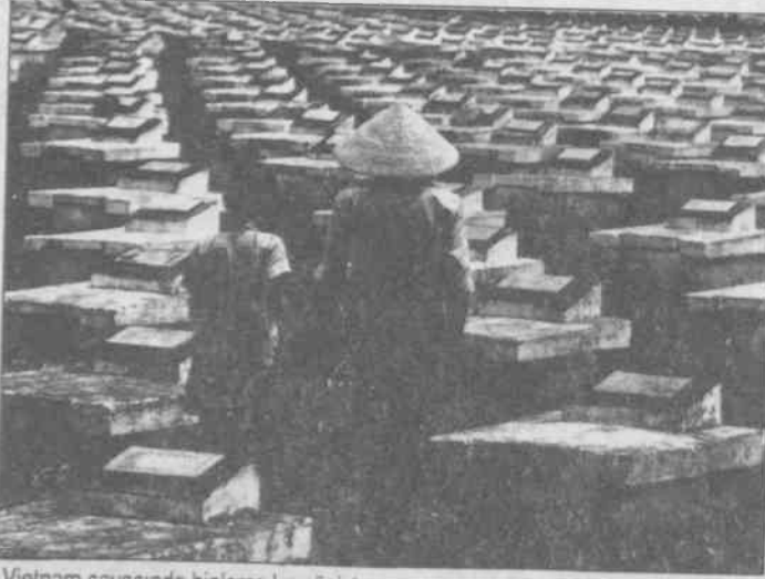
Vietnam savaşında binlerce komünist-yurtseveri katleden ABD şimdi de sermaye bombardımanı yapıyor.