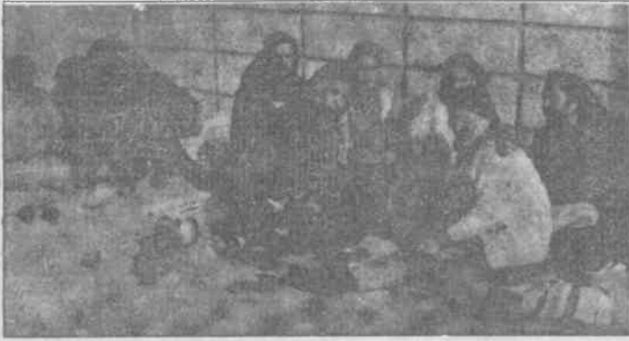
İşçiler "Ya iş başı yaparız, ya da buradan cesedimiz çıkar."

İşgallerini işbaşı yapana kadar sürdüreceklerini belirten işçiler,