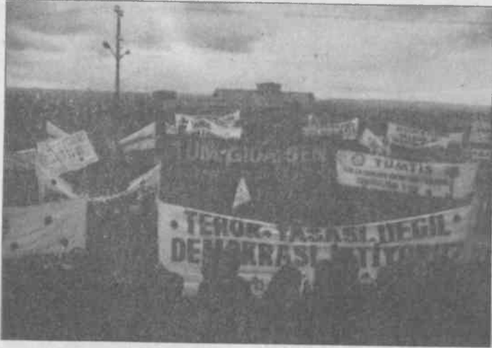
Ankara-Kasalar'da yapılan miting öncesi DİSK ve Türk-İş ağaları "Miting iptal edildi." yalanını söylediler.