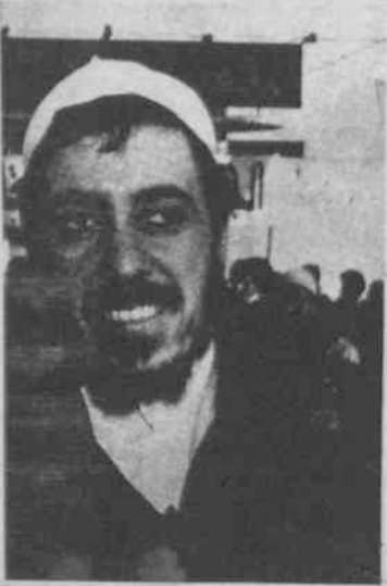
FİS lideri Rabah Kebir