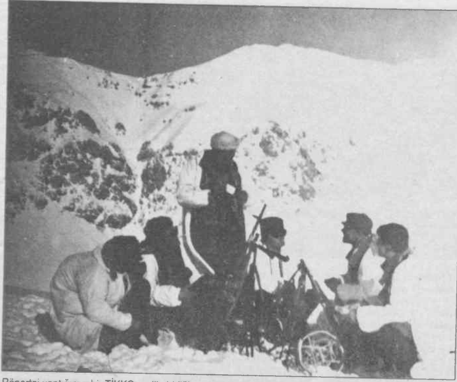
Röportaj yaptığımız bir TIKKO gerilla birliği.

— Çiller'in emperyalistler sofrasındaki alımlı turu da bu çözüm arayışında, destek bulma amacını güdüyordu ve kendi alanında bunu önemli ölçüde de başardı. Ama esas sorun, emperyalistlerin Çiller'in "tatlı" diline kandığı şeklinde olamazdı, çünkü kurtlar so-