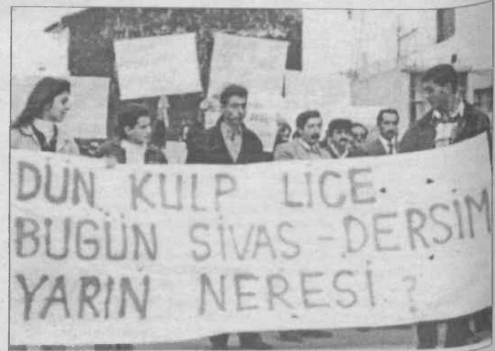
Dersim'deki katliam ilercisi kitle örgütlerince Kartal'da protesto edildi

Basın açıklamasını destekleyen kurum ve kuruluşlar şunlar: İHD, ÇHD, Pir Sultan Abdal