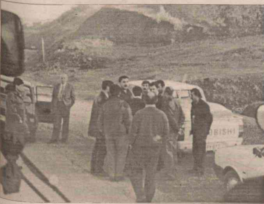
34 Demokratik kütle örgütünün oluşturduğu platform, Dersim'i sahiplendi. 54 kişilik heyetin gezisiyle faşizmin yüzü teşhir edileceğinden, TC. güçlerince engellendiler. Ama, bu teşhiri gizleme çabası, teşhirlerini daha da kolaylaştırmıştır.

■ Hakim sınıflar, sınıfsal ve ulusal mücadele yürüten gerillalarla bağıni koparabilmek için, halkı merkezlerde toplamaya çalışıyor.