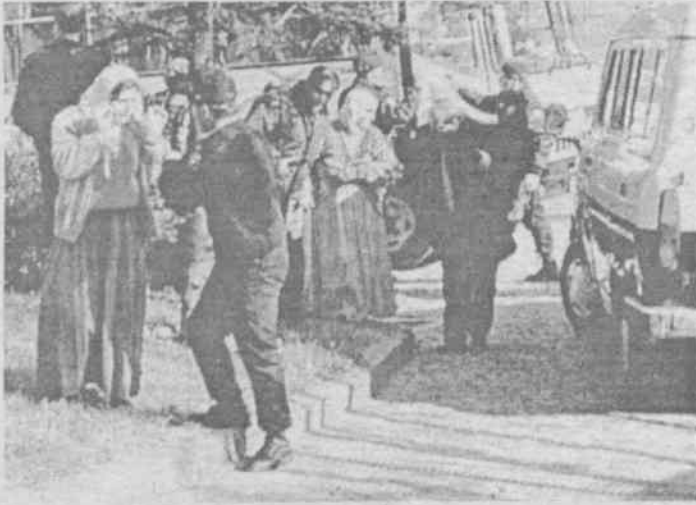
Başbakanlığa çıkmaya çalışan tutsak ailelerine polis saldırırken

Gaziantep Cezaevi: Diyarbakır Cezaevi'nden Antep Cezaevi'ne sürülen tutsakların bu saldırıyı ve baskıları protesto için başlattıkları süresiz açlık grevi 12 ekim günü 15 tutsak tarafından ölüm orucuna dönüştürüldü. Antep'e sürülen 294 tutsağa fiziki ve psikolojik işkence yapıldığı, çok sayıda tutsağın yaralı olduğu gelen bilgiler arasında.