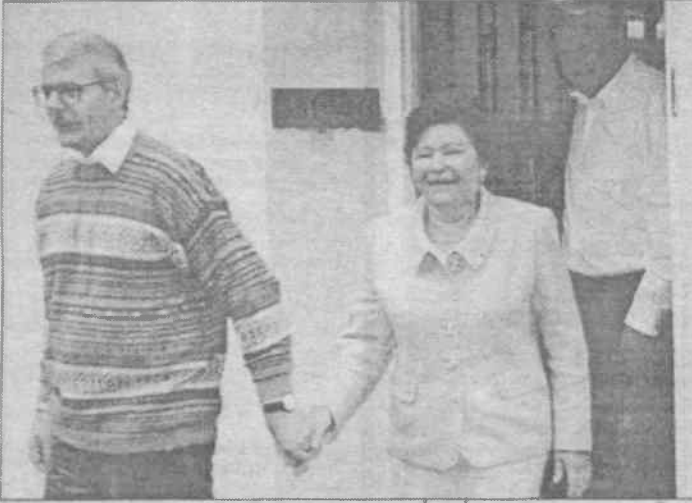
MAJOR'LA BAYAN YELTSİN'İN KAÇAMAGI