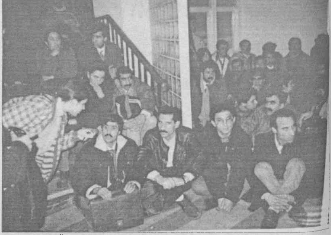
Demokratik Kitle Örgütleri Platform temsilcileri Çankaya Belediye Binası'nda "oturma eylemi" gerçekleştirirken