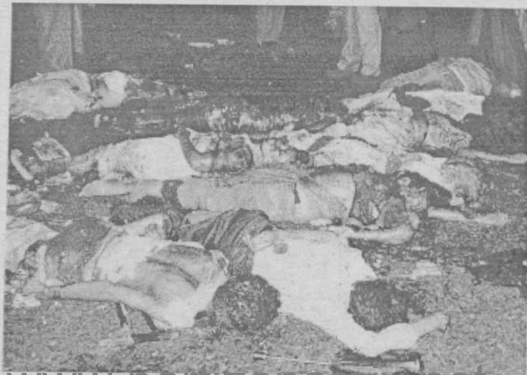
Tamil Eelam Kurtuluş Kaplanları'nın bombalı saldırısı na 1 Ocak'ta 50'ün üzerinde de telefçisi öldü.