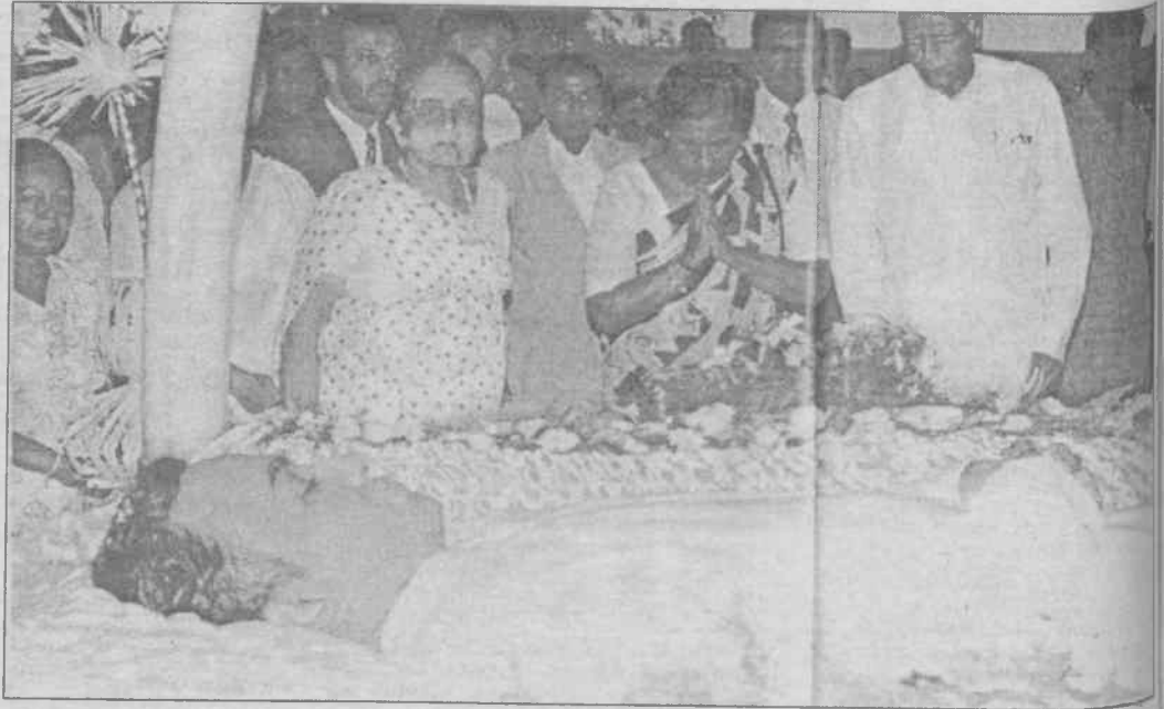
Birleşik Ulusal Parti lideri Dissanayake, Gandhi'nin akıbetine uğradı.

Dissanayake'nin öldürülmesinden sonra, açıklama yapan bir Kaplan temsilcisi, suikasti kendilerinin yapmadığını açıkladı. Fakat