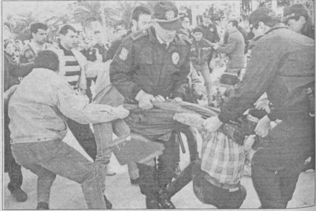
Eylemi düzenleyen öğretim görevlileri olduğu halde, dayığı yiyen yine öğrenciler oldu.

Toplantıda konuşma yapan İstanbul'un yasaları Fakültesi Prof. Dr. Süleyman Demirel'in öğretim görevlileri devlet, üniversite