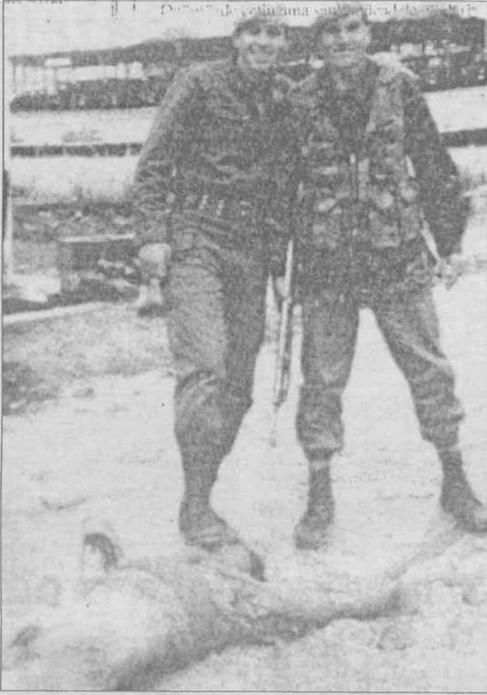
Taa Somali'deki hayvanlığı gören burjuva basını burnunun dibindeki hayvanlığı gizlemeye çalışıyor

GATA'da kendisi de psikolojik tedavi gören piyade binbaşı E.Ç ise, halen GATA Hastanesi'nde karantına kayıtları dışında, 170 subay ve astsubayın "ruhsal rahatsızlık"ları nede-