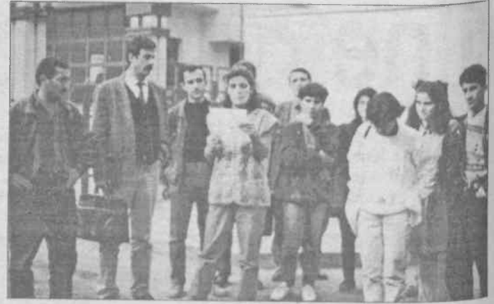
Kağıthane Öztek işçileri gerici patrona karşı birleşmeli