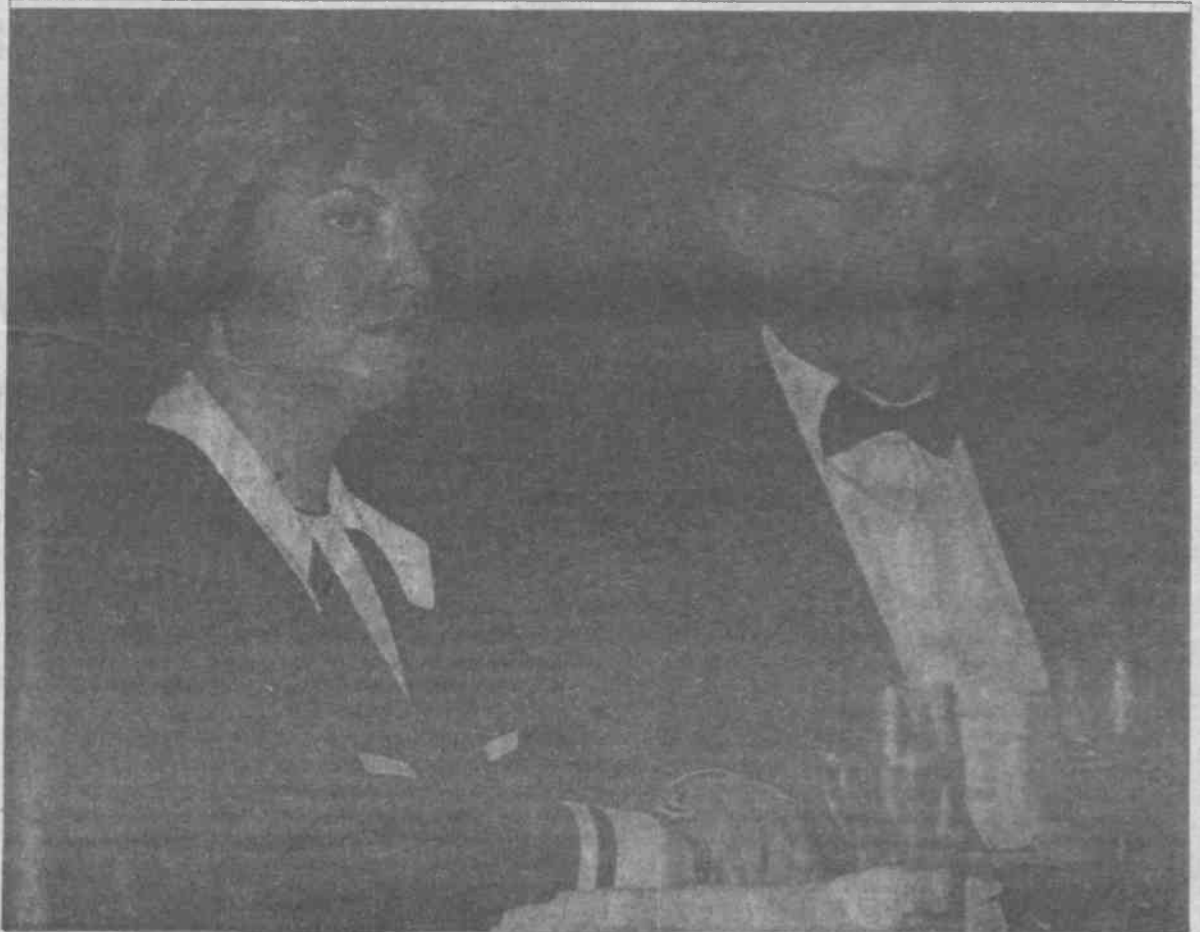
Telefon skandalı Doğan Güreş'inde aslında onayladığı "görev süresini uzatma" çabasının noktalanmasına neden olmuştur.

(IK. Seçme Yazılar sf. 430-31, Umut Yayıncılık)