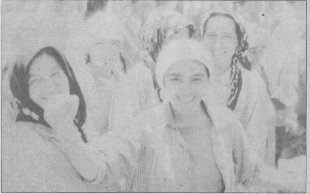
Sümerbank işçisinin Temmuz 1993 direnişinden bir görüntü

Sümerbank'ta çalışan bir işçi konuyla ilgili olarak şunları söylüyor: "İki haftadır işçileri zorunlu-ücretsiz izinlere çıkarmaya başladılar. Daha önce izine çıkan işçilere para ödendiği için, çalışan işçilere para verilmiyor. İkramiyeler, vergi idareleri, maaşlar verilmedi. Fabrika bilinçli bir şekilde ekonomik krize sürükleniyor. Buna karşı bir örgütlülükte yok. Zaman zaman işçiler toplanıyor, sendika temsilciliğini basıyor. İşçilerin çoğu sadece ekonomik mücadele veriyorlar. Bu siyasi mücadeleye dönüştürülmediğinden, gerçek anlamda örgütlülük olmadığından fabrikada bir kriz yaşanıyor. Fabrika zarar ediyor gibi gösterildiği için, işçiler de zaten bilinçsiz, özelleştirmeyi ele aldığımızda, özelleştirmenin ne olduğunu bilmiyorlar. Çok az insan özelleştirmenin özünü biliyor. Fabrikaya gecikmeli olarak kumaş gönderiliyor, aylık gönderiliyor. İş az olduğu için biz bunu taşıyamıyoruz, kaldıramıyoruz, zarar ediyoruz şeklinde bir görüntü yaratılmaya çalışılıyor. Orası 3 büyük konfeksiyon ve 1300 kişi çalışıyor. Ben bant birinci kısımdayım. Bizim bölümümüzde daha önce 12 bant vardı. İşten "gönüllü" çıkarılmalar oldu. Bu da nasıl oldu? Patronun pro-