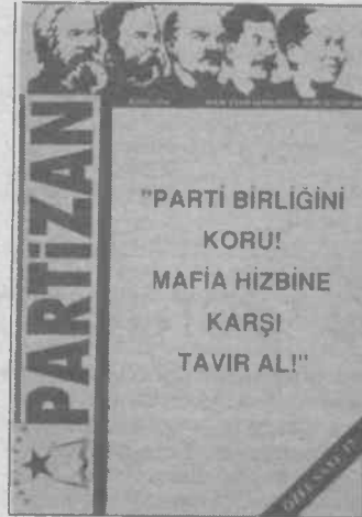
Korsan çıkan Partizan

Çeşitli milliyetlerden emekçilerin önderliğine soyunan ve özgür geleceğin yaratılmasında rehber olacak niteliğe sahip TKP(ML) içerisindeki bu olaylar karşısında da (nasıl ki DS içindeki olaylara