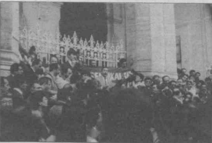
Memurlar, Sirkeci Büyük Postanesi önünde, öfkelerini dile getirdiler

Memurlar, KÇSP'nin çağrısı üzerine, Başbakanlık'a gönderilmek üzere hazırlanan dilekçeleri,