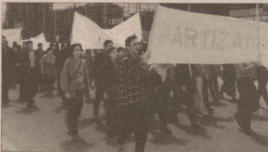
Ankara'da yapılan 1 Mayıs kutlamalarında yaklaşık 15 bin kişi yürüdü