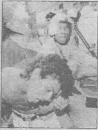
Kosta Rika polisi işçileri dövdü