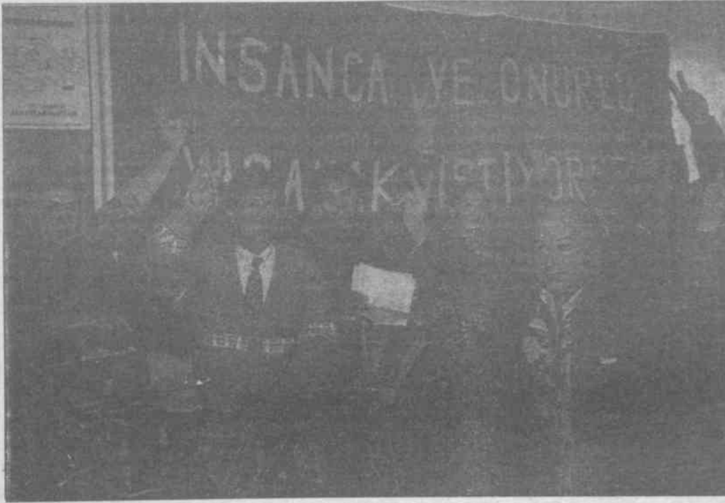
Demokrasi Mücadelesinde Sakatlar "Onurlu bir yaşam için mücadeleye devam" diyorlar

artarak devam etmiştir. Yönetim devletle ilişkilerinde sürekli birbirlerini kutlayarak kendi kitleleriyle olan ilişkilerini açmış, sürekli yabancılaşarak bu güne kadar gelinmiş. 1981 yılından beri kullanılan Sakatlar Haftası, valiliğin dayatmış olduğu bir programla yürütülüyordu. Dernek yöneticileri de bu programı kendi "katkılarıyla" iyice bir şenlik havasına sokuyorlardı. Biz sorunlarımızı bilen, toplumumuza değerlendiren sakat kişiler olarak tam 4 yıl içinde, bu şenlikleri bayram havasından çıkarmaya çalışıyorduk. Bunu yürüyüşlerle, pankartlarla, sloganlarla, dövizlerle bir dereceye başardık.