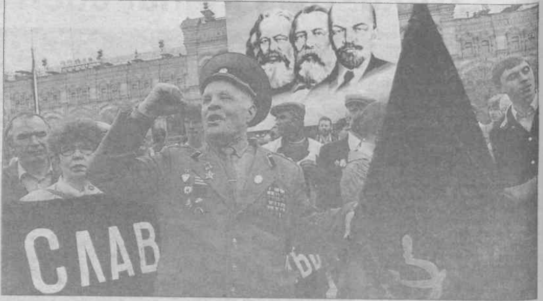
Rusya'da 1990 1 Mayıs'ından bir görüntü

Gagarin Meydanı'na gelen kitle, geçtiğimiz yıl burada katledilenle-