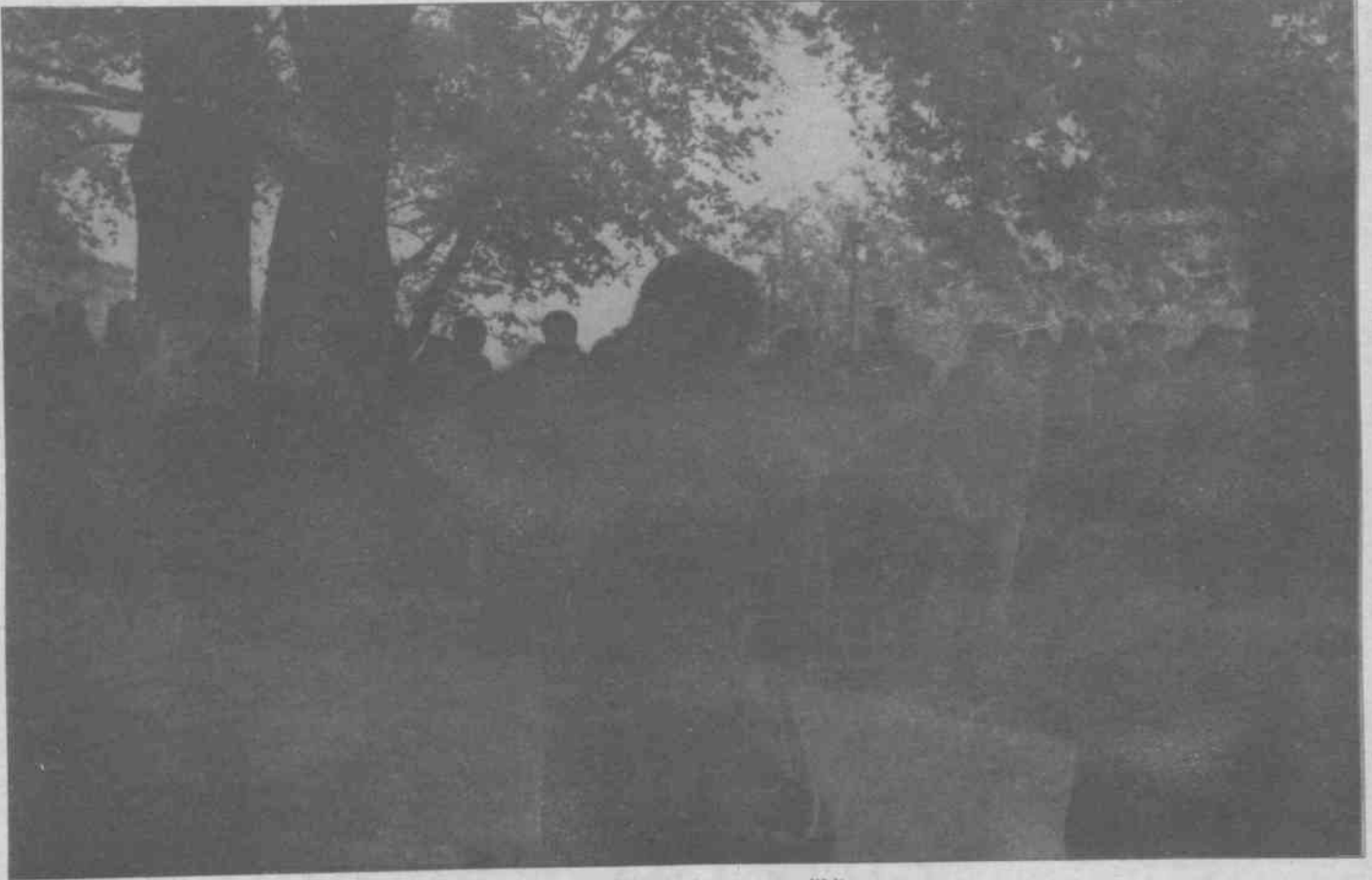
F.Y'ye yapılan işkence ve tecavüz duyarlı kesimler tarafından çeşitli yerlerde protesto edildi.

Devlet halkın değer yargılarını iyi bildiği için işkencede cinsel taciz yada tecavüz yöntemlerini oldukça sık kullanmaktadır. Helede bundan sonuç olacağını bilirse- ki genç kızlar yada feodal değer yargılarının et-