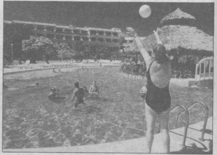
Varadero Plajı Batista döneminde de Castro döneminde de aynı: Doları olanlara açık

Rus petrolüyle değişim yapmak için, Castro, ülkenin tarıma elverişli arazisinin hemen hepsini şeker kamışı tarlalarına dönüştürdü. Bu da yetmedi. Ülkenin yiyecek kay-