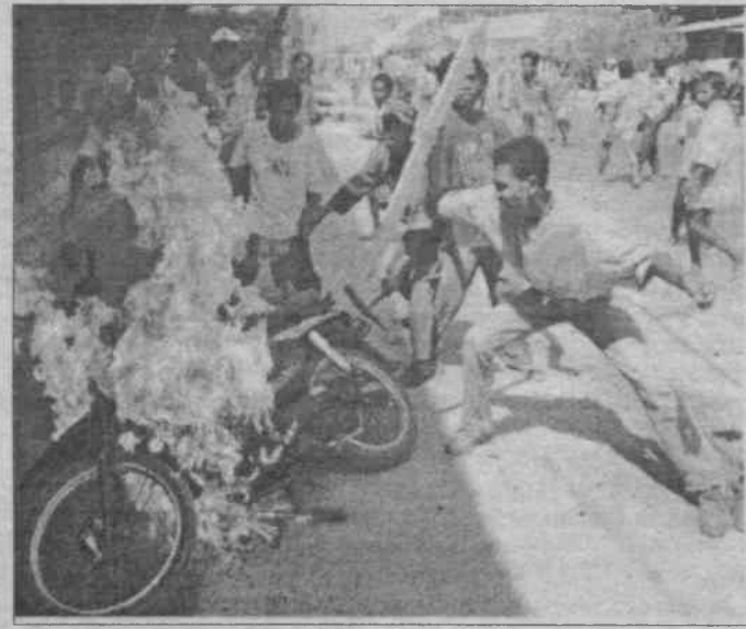
APEC Zirvesi sırasında, Doğu Timor'un başkenti Dili'de, Endonezya'nın işgalciliği protesto edildi.

Ancak gerçekler inatçıdır. Suharto'nun, 2020 yılına kadarlık bir