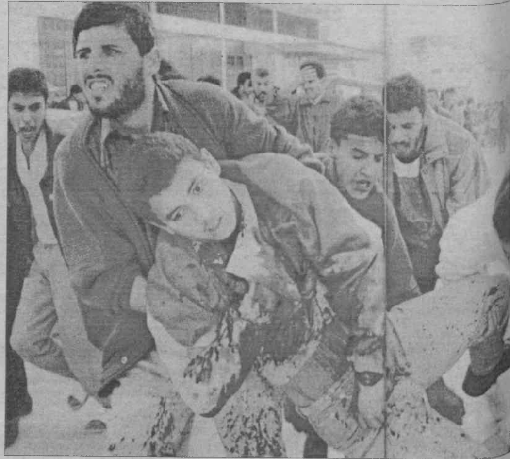
16 kasım günü, Gazze Şeridi'ndeki Filistin Camii'nden çıkan kalabalığa Filistin polisi tarafından pervasızca ateş edildi. Bilanço: 15 ölü ve 200 yaralı.

Katliam ise, 18 kasım cuma günü yapıldı. Gazze Şeridi'ndeki Filistin Camii'nde ibadet eden insanlar, Arafat'ın askerleri tarafından uyarıldılar. Yaklaşık 50 Filistinli polis ve asker çevreyi sardı. Sloganlar eşliğinde radyo yayınıyla, 4 araçtan yapılan anonslarla gözdağı veriliyordu. Zira, Gazze Şeridi radikal İslamcıların adeta merkezidi ve camidekiler son tutuklamaları protesto etmeye hazırlanıyorlardı.