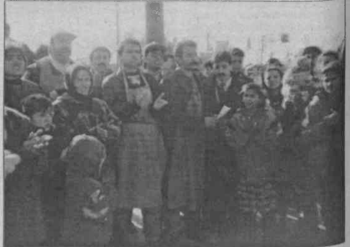
Tez Koop-İş 4 No'lu Şube yöneticileri sendikalaşmak isteyen işçileri Terörle Mücadele polislerine ihbar etti.

Tez Koop-İş 4 No'lu Şube Başkanı eylemci işçilerin söylediklerini doğrulamazken şöyle dedi. "Biz sendikacıyız, tabii ki işçilerin