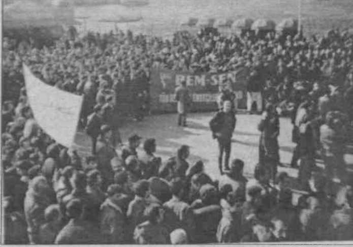
Emekçiler eylemlerini halaylarla süslediler.

Kalabalık bir emekçi kitlesine okunan basın açıklamasında; kamu emekçileri, başlatıldıkları sendikal hak ve özgürlük mücadelesinde elde ettikleri sendikal haklarının elerinden alınarak sendikaların dernekleştirilmesine izin vermeyeceklerini ve insanca yaşama hakkı için, TİS ve GREV hakkı için üretimden gelen güçlerini kullanarak mücadeleye devam edeceklerini belirttiler.