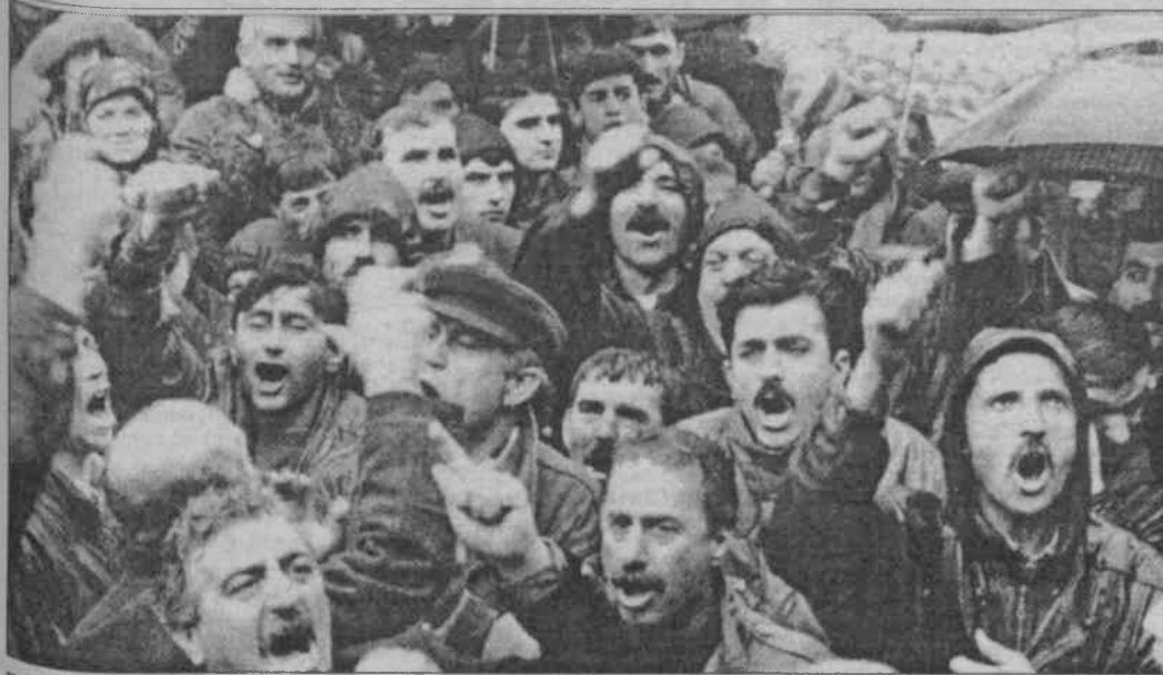
Zonguldak halkı bir bütün olarak TKİ işçileriyle birlikte ocakların kapatılma kararını alanlara çıkararak protesto ettiler.