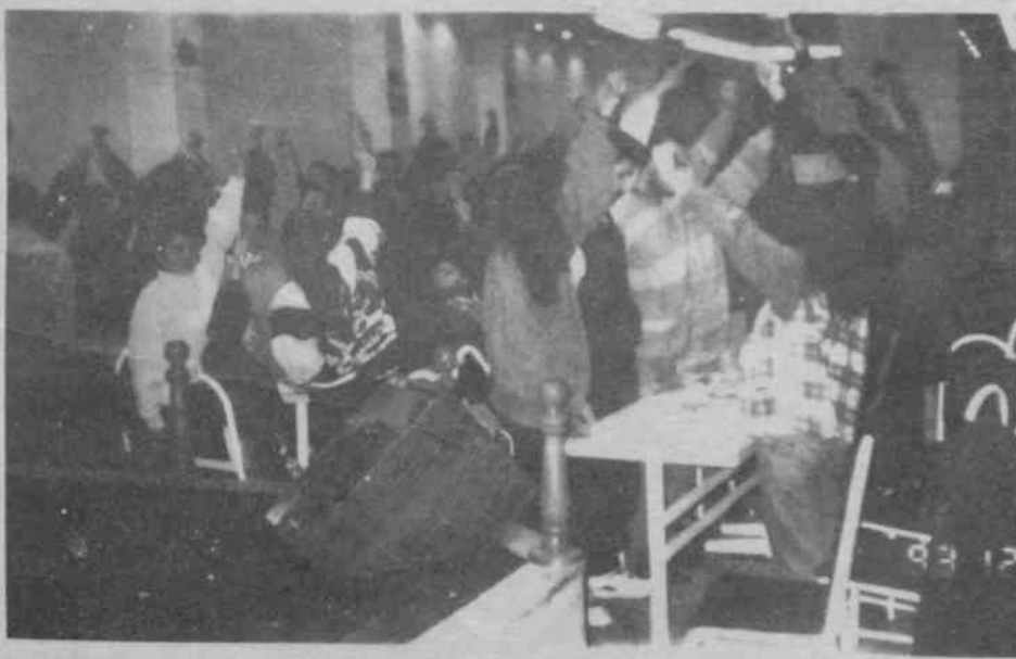
Devrim şehitleri mücadelemizde yaşıyor, yaşayacak!

Çesitli mesajların okunduğu gecede, Emekçi Kadınlar Birliği'nin "Haksız savaşa oğul yollamayın, İdamla-