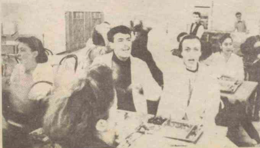
Hastane çalışanları, polis saldırıları arttıkça radikalleşiyor.