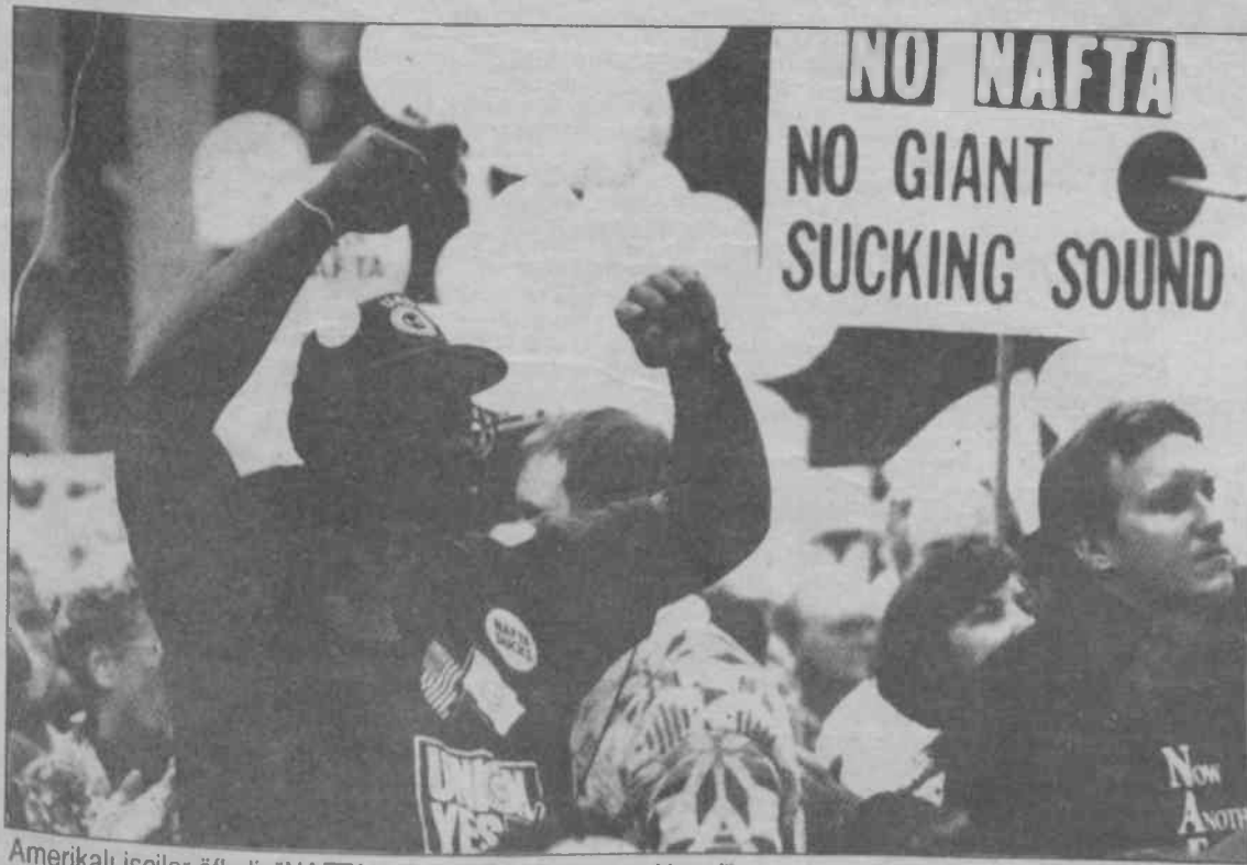
Amerikalı işçiler öfkeli: "NAFTA'ya hayır! Dev Pompaya Hayır!"

Son bir not: Peru Komünist Partisi, Maoçuluğun tari- hi önemini vurgularken Onun Marksizm ve Leninizm katkılarını sıralamada, Büyük Proleter Kültür Dev- rimi'ni beşinci sıraya koyuyor. Görüşlerine saygım ola- makla birlikte şerh koyuyorum. Kanımca Kültür Dev- rimi, ilk maddeyi oluşturmalydı.