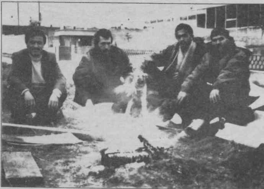
İşçiler "sonuna kadar direneceğiz" dedi.

Bunun üzerine kendilerini önmek alan Teodem patronları, Ayvazdağındaki imalathanede de malları tükettiler ve yeni siparişlerin başka bir imalathanede işlenmesini sağladılar.