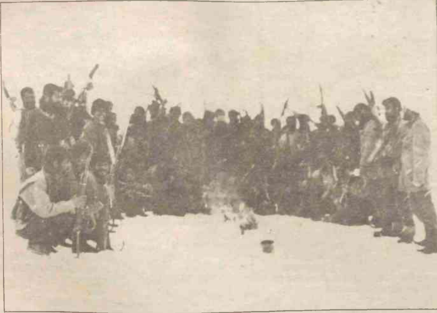
Çeşitli milliyetlerden halkın umudu, dağlara çekilmiş kar üstündedir ve hedefine doğru yürümektedir.

■ Kış aylarında gerillanın sığınaklara çekilmesiyle mücadeleyi geriletmiş propagandasını yaparak acizliğini gizleme fırsatı yakalayan egemen sınıflara, TKP/ML TIKKO bu kış şimdiye kadar bu fırsatı vermemiştir. 3. Sayfa