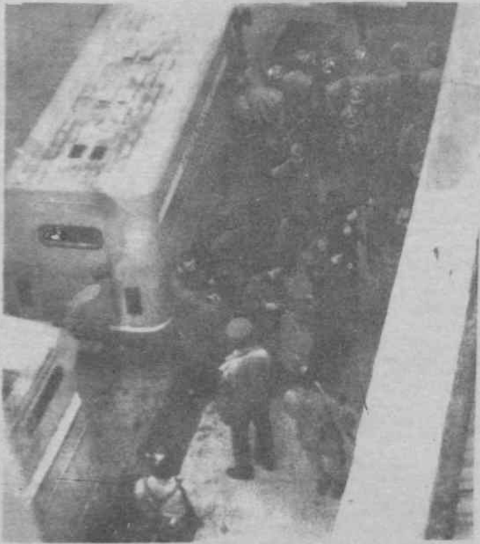
Geçmişte zincirli sevki de denemişlerdi. Kaybettiler...

22 Aralık'ta bir basın açıklaması yapan tutsaklar; "Demokratik hak ve özgürlüklerin, egemen güçler tarafından 'zor'a dayalı olarak tepedildiği ülkemizde, seçim meydanlarında bu istemleri dile getirecek, iş başına getirilen DYP-SHP koalisyon hükümetleri de bu vaatlerini unutup egemenlerin istemleri doğrultusunda var olan 'zor' yasalarını daha da genişleterek yasallaştırmaya çalışmaktadır." dediler. "Egemen güçler sömürlerini daha rahat sürdürmek ve bu sömürü politikalarına karşı çıkan devrimcileri susturmak için, şimdi de çıkarılmak istenen 'devlet terörü' yasasıyla toplumdaki en ufak bir demokratik kıpırdanmayı bile suç saymakta, bununla birlikte 'İdam' cezalarının infazlarını yeniden gündeme getirmeye çalışmaktadır." saptaması yapılan açıklamada; "Bütün bunların bir devamı olarak zindanlara doldurdıkları siyasi tutsaklar üzerindeki baskılar da yoğunlaştırılmaya başlanmıştır. Şöyle ki; koalisyon hükümetinin Adalet Bakanlığı tarafından yayınlanan 27 Temmuz 1993 genelgesiyle İstanbul DGM'lerince tutuklanan siyasi