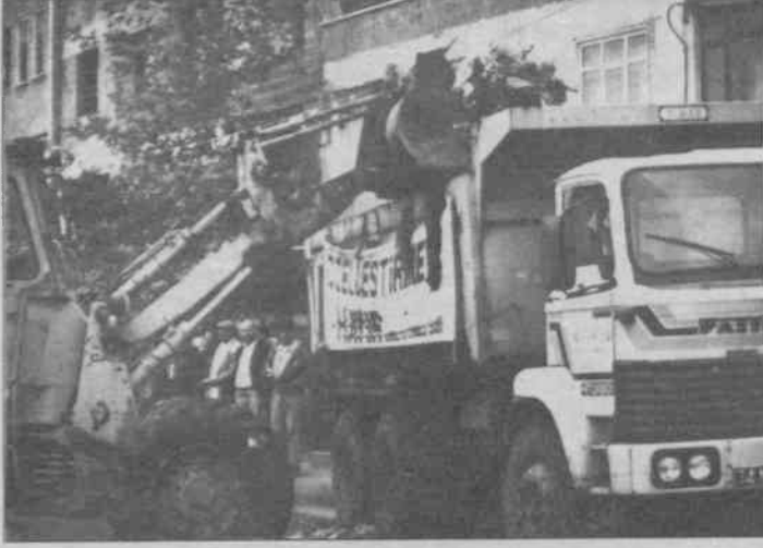
Temizlik işçileri Küçükçekmece'de çöpleri toplamaya başladılar.

Diğer eylemlerde olduğu gibi, bu direnişe neden olan da işçinin ödenmeyen haklarıydı. İşçiler 1992 Mart ayında bu yana geçerli olmak üzere imzaladıkları toplu sözleşme farklarını, aynı yılın sosyal