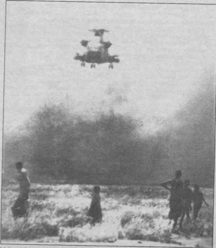
Yoksul Somali halkına modern "yardım"

Ama gerçek durum tamamiyle farklıydı. Amerikan işgalinden önce, Kızılhaç ve diğer örgütler, Somali'deki kıtlıktan etkilenen alanlara gıda dağıtıyorlardı. Gıdanın yağmadan en az kayıpla kurtulabilmesi için çeşitli silahlı kabile gruplarıyla anlaşmaya oturdular. Kıtlık hâlâ ciddiye ve insanlar hâlâ ölüyorlardı. Ancak yüklenen hububatlar pek çok kırsal yardım merkezine ulaşıyordu. Somali'deki yardım durumunu konusunda dünyaca tanınmış bir uzman olan Rakiya Omar, Amerikan denizcilerinin Aralık'taki gelişlerine kadar, açlıktan ölüm oranının yazın kuraklık derecesiyle karşılaştırıldığında esaslı bir şekilde azaldığına dikkat çekiyordu. Başkent Mogadishu gibi yerlerde