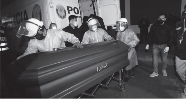
HABER MERKEZİ- 29 yıllık tutsaklığın ardından faşist Peru devleti-