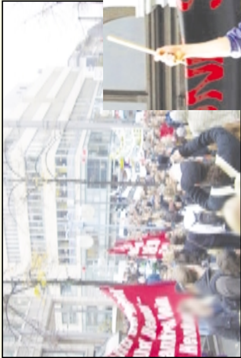
A l m a n y a