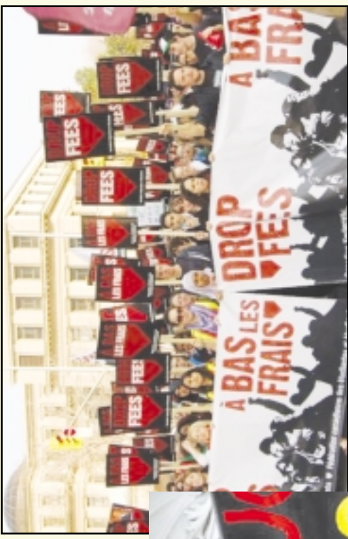
K a n a d a