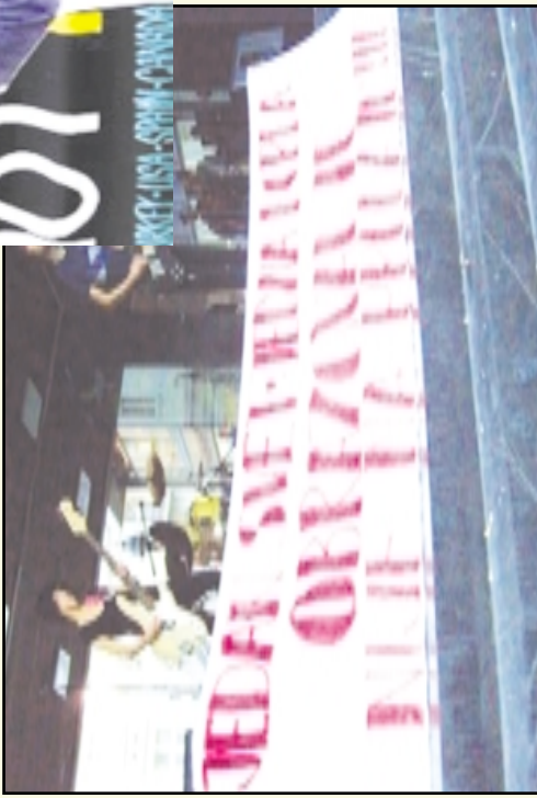
B e l g r a d