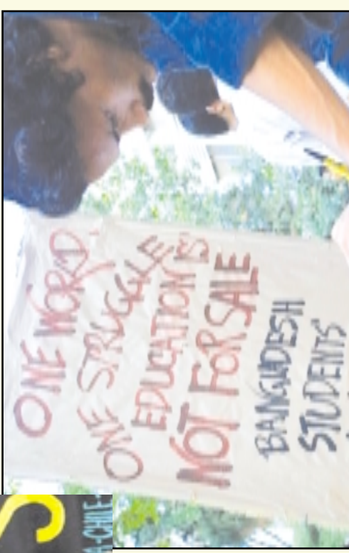
B a n g l a d e ş