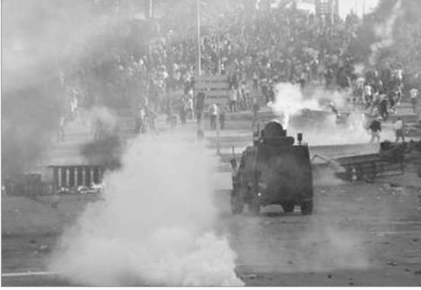
“Copla ve tek melerle saldırdılar”

Miting bittikten sonra kitleyle birlikte cami-cemevi inşaatına doğru yürüyüşe başladık. Polisin saldıracağı zaten konser sırasında üzerimizde gezen helikopterden ve etraftaki sivil polislerin yoğunluğundan belliydi. İnşaata gelmeden akrep ve TOMA ile saldırı başladı. Bu sırada çevik kuvvet polisleri de alana dört bir yandan girmişti... Ben de akrep ve TOMA ile ilk saldırı başladığında gazın etkisiyle arkamı dönerek geri çekilmeye çalıştım. Ancak arkamı döndüğünde onlarca çevik kuvvet polisini gördüm. Elllerinde copla saldırıya hazır bir şekilde bekliyorlardı. Ve beni görünce saldırmaya başladılar... İsteseleler gözaltına da alabilirlerdi ancak dayak onlara daha “cazip” geldi... onlar gidince yan taraftaki inşaata girdim. Burada başka bir arkadaşla birlikte saklandık. Bu arkadaşta da aynı yerde saldırmışlar... Biz buradan çıkmayı başardık ve yeniden kitlenin arasına girdik... Hemen hastaneye gittim... Ciddi bir durum olmadığı söylendi.