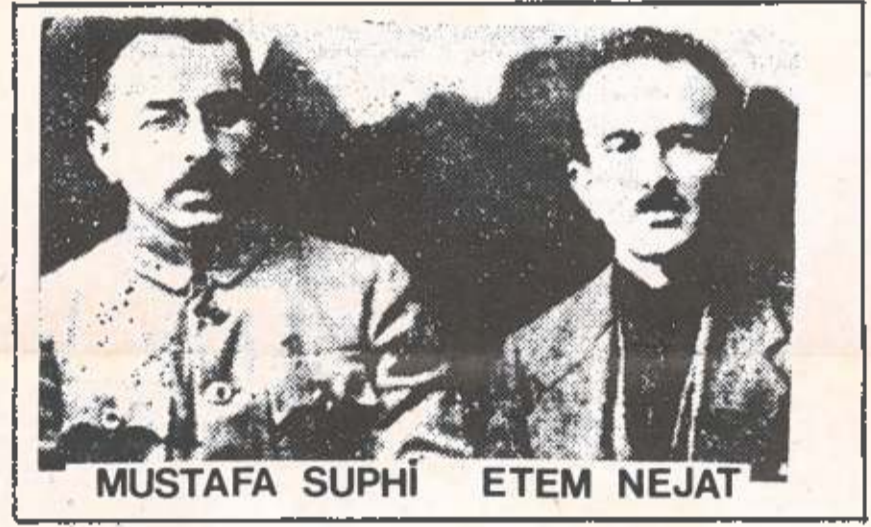
MUSTAFA SUPHİ ETEM NEJAT

Hayali gönlümde yadigar kalan Bir yanım deryada çalkalanır şimdi 15 yoldaş ile boğulup ölen Bir yanım deryada çalkalanır şimdi.