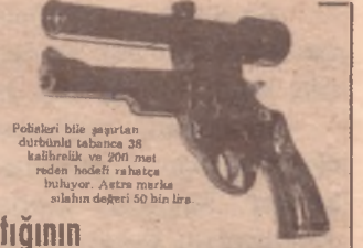
Pobeleri bile şaşırılan dürbünlül tabanca 38 kalibrelik ve 200 metreden hedefi rahatca buluyor. Astra marka silahın değeri 50 bin lira.