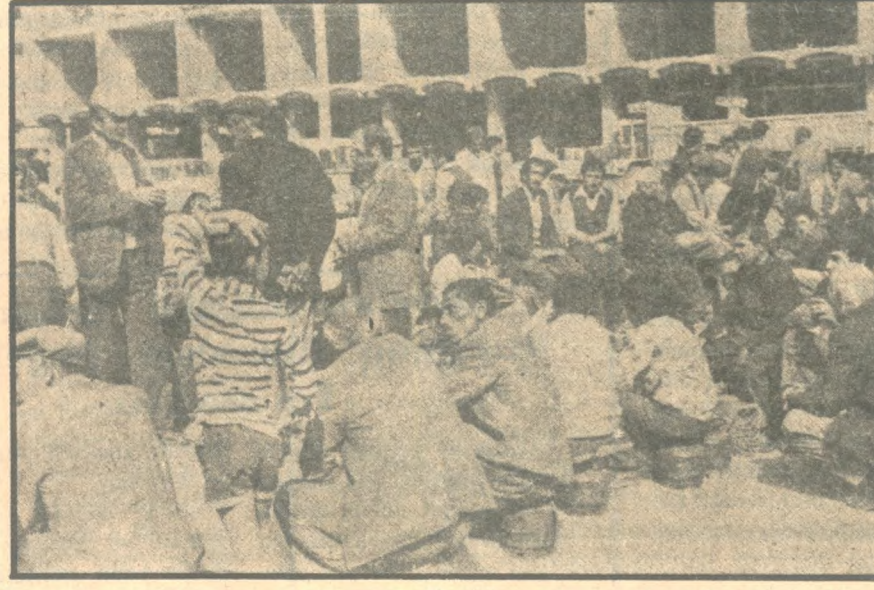
Kuyrukların sebebi emperyalizme bağımlı komprador patron-ağa düzenidir.

İşçiler, köylüler, Dar gelirli esnaf ve zanaatkarlar, Öğretmenler, öğrenciler, Çeşitli milliyetlerden emekçi halkımız!