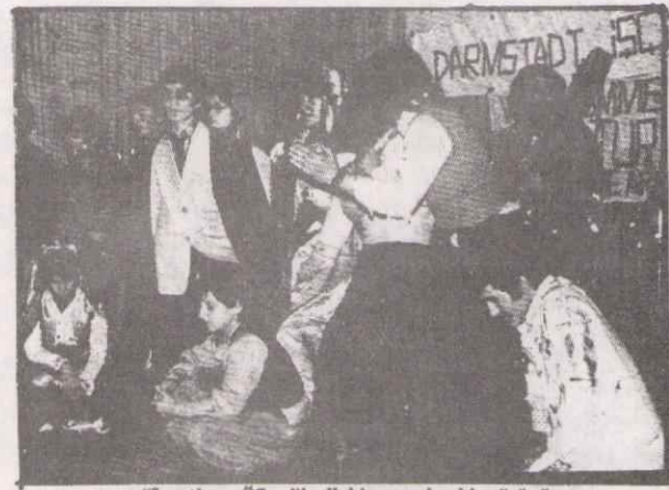
"İrgatların Öfkesi" adlı bir oyundan bir görüntüm

Geceye katılan "Gaziantep" "Elazığ" folklor ekibi gerek kıyafetleri gerekse oyunlarıyla büyük ilgi görmüştür.