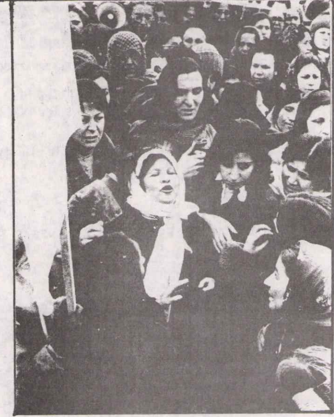
EVLAT ACISINA SON MITINGİ!

Çocuklarımıza dayak atılıyor. Elektrik işkencesi yapılıyor olağanüstü mahkemelerde, olağanüstü hukukla yargılıyor ve öldürüyorlar. Faşizm musibeti başımızdadır.