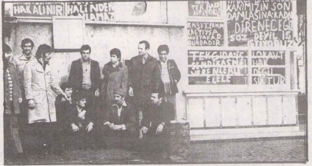
LEVENT EKMEK FABRİKASI GREVİNE KATILANLAR!

Levent Ekmek fabrikasında işverenin motörleri söküp işyerini terk etmeleri üzerine 23 işçi uzun zamandan beri sürdürdükleri grevden sonra babadan kalma usulle ekmek pişirerek fabrikayı çalıştırmaya başlamışlardır. Mücadeleden yılmayan 23 işçi "günde 15 saat çalıştırıldıklarını ve hiçbir sosyal haklarının ödenmediği" Levent Ekmek fabrikasında şimdi "İnsanlık dışı çalışmaya paydos diyerek canla başla çalıştıklarını belirtmişlerdir.