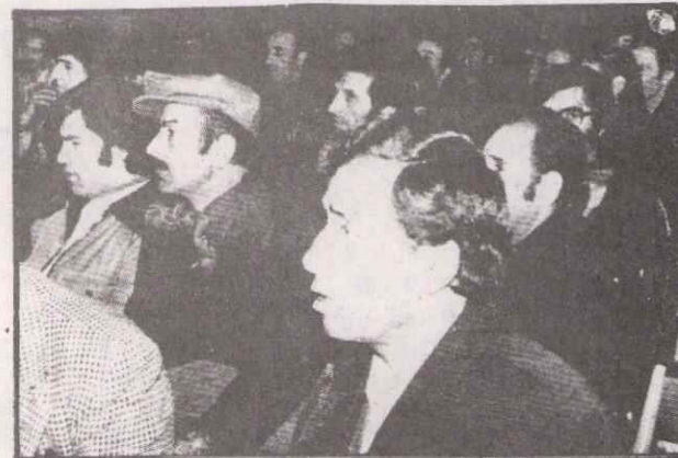
Geceye katılanlardan bir grup