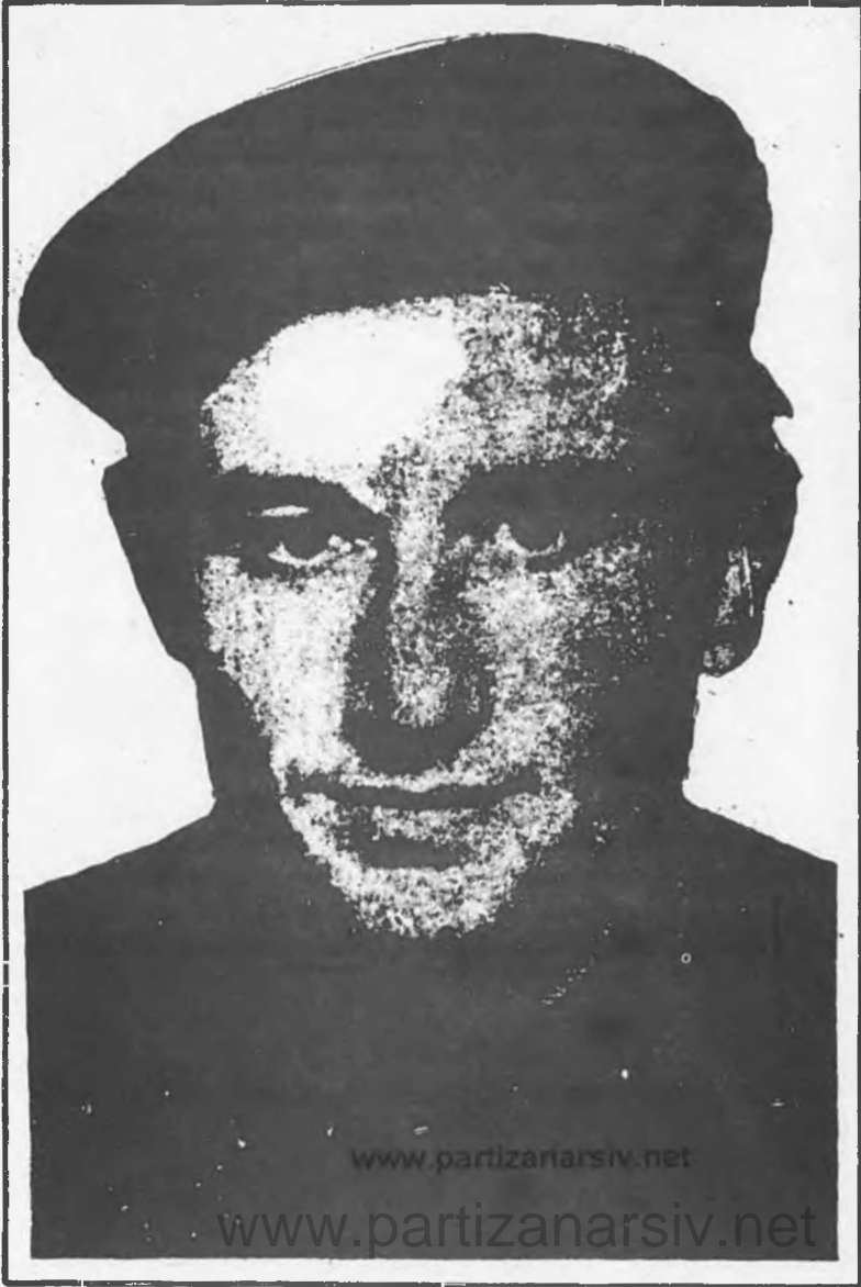
IBRAHİM KAYPAKKAYA (1949 - 1973)