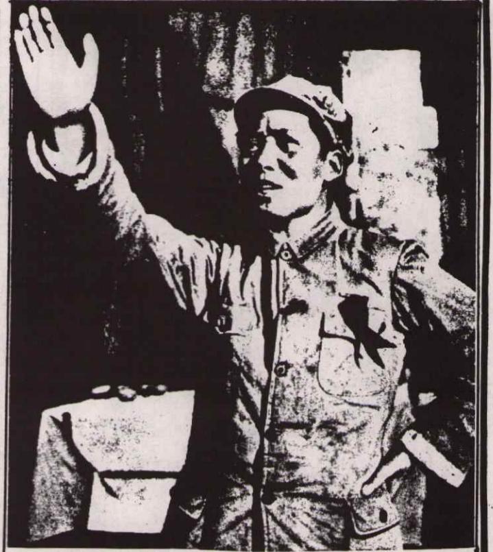
Mao Zedung 1939 yılında Yenanda Çin halkının anti japon askeri siyasi akademisinin 3.ku-ruluş yıl dönemi dolayısıyla konuşma yaparken

Mayıs ayında Mao, bütün Çin Köylü Bir-liği başkanlığına seçilir. Mayıs ayı Kuo-mintang'la işbirliğinin de sona bulduğu aydır. Çan Kay Şek önderliğindeki Kuomin-tang birlikleri, komünistlere karşı ge-len bir saldırıya geçerler. Bu saldırıda ÇKP ağır bir yenilgiye uğrar. Çünkü böyle bir saldırıya karşı hazırlıklı değildir. Parti içinde hakim olan sağ çizgi, cephe içinde partinin bağımsızlığını ortadan kaldırmıştır. 10 yıllık iç savaş dönemi başlar. Partide sağ çizginin yerine kısa bir dönem sol çizgi hakim olur. Merkez her yerde derhal ayaklanma direktifi ver-ir. Mao Zedung Hunan'da "Sonbahar hasa-tı ayaklanması" adı verilen ayaklanmayı yönlendirir. Ayaklanma bastırılır. Mao çevresindekilerle birlikte Çingang dağlarına çekilir. Ekim ayında, Mao Ze-dung ÇKP yönetim kademesinden uzaklaş-tırılır.