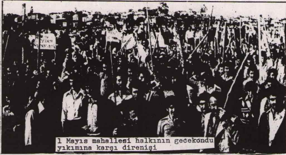
1 Mayıs mahallesi halkının gecekondu yıkımına karşı direnişi

Geçen ay içinde İstanbul, bir Mayıs mahallesi, faşist devletin baskıcı güçleri tarafından kana boyandı, 1 Mayıs gecekondu mahallesinde yıkım sırasında faşist polis halka saldırdı. Halk polisin saldırısına karşı yiğitçe direndi. Bu direnişte, resmi rakamlara göre 6 direnişçi şehit düştü. Gecekondu mahallesi halkı, ölü ve yaralı sayısının daha fazla olduğunu söylemektedir. ATIF gecekondu yıkımı ile ilgili aşağıdaki bildiriye çıkardı. Bu bildiriye yayınlıyoruz.