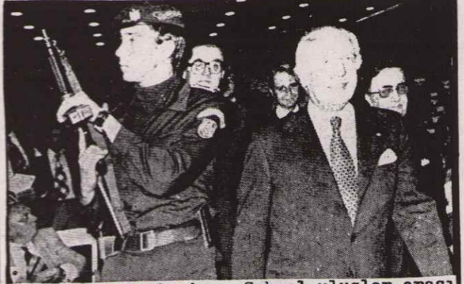
B. Alman cumhurbaşkanı Scheel uluslar arası bir toplantıyı açmaya gidiyor.

Geçen ay içinde Batı Almanya'da 'Kızıl Ordu Fraksiyonu' (RAF) adlı bir örgüt; Alman İşverenler Sendikası Başkanı; işçi düşmanı Hans Martin Schleyer'i kaçırdı. H. Martin Schleyer Prag'ın işgali sırasında Nazi işgal güçlerinin Maliye Bakanlığı görevini yapmış; Nazi partisinin önde gelen 'ekonomi uzmanlarından' biri idi. Kendisi Deimler Benz-Mercedes Firmasının Yönetim Kurulu başkanı; ve bütün Batı Alman patronlarının, yani Batı Alman emperyalistlerinin bir numaralı temsilci ve sözcüsü idi.