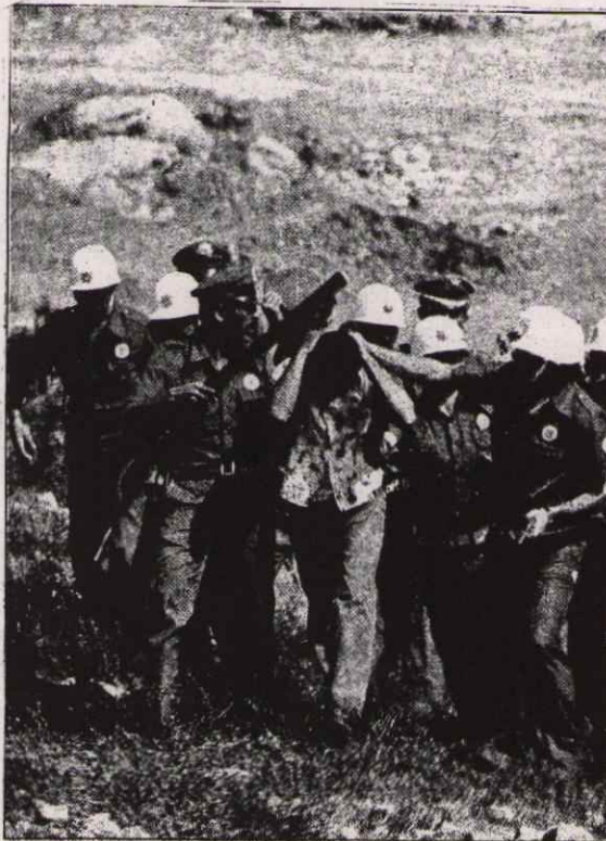
2. MC döneminde gecekondu yıkımı

İşte hakim sınıflar bize bunu bile çok görmektedir. Onlar bizleri evsiz barsız koymakta, gecekonducumuzu başımıza yıkmaktadır.