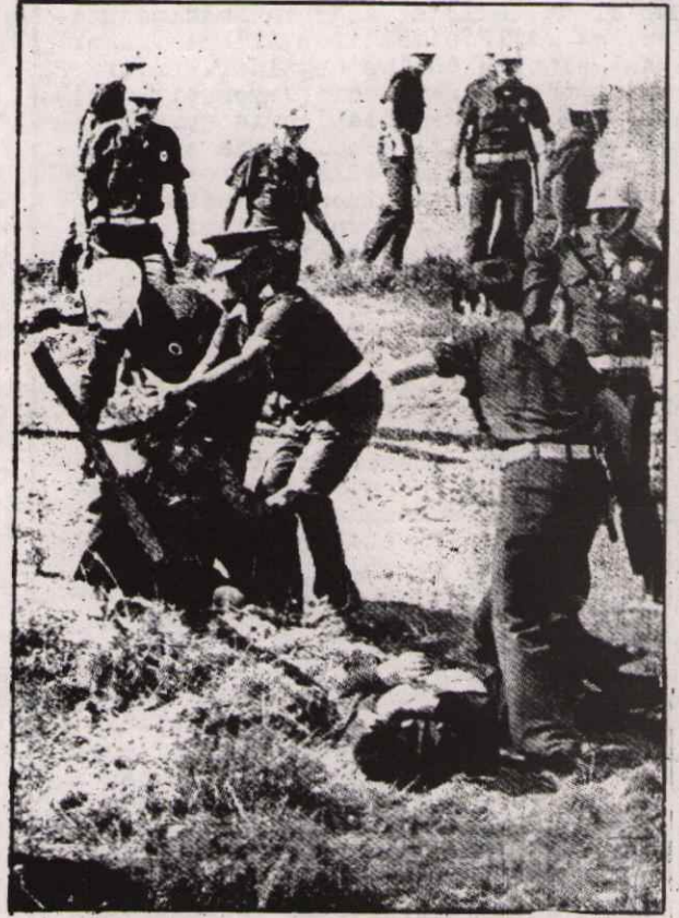
acevit döneminde gecekondu yıkımı

Halkımız her geçen gün daha açık bir şekilde, açlığın, yoksulluğun, sefaletin evsizliğin sebebinin; komprador patron ağa düzeni olduğunu kavramaktadır. Her geçen gün daha açık bir şekilde, Türkiye emperyalizme bağımlı kaldıkça; Türkiye'de emperyalizm, komprador kapitalizmi ve feodalizm hüküm sürdüğü, halk için sömürü ve zulmün sonunun gelmeyeceği görülmektedir. Her geçen gün daha açık bir şekilde baş eğmenin sonunun gelmeyeceği, sömürü ve zulme karşı direnişin bir hak ve görev olduğu görülmektedir.