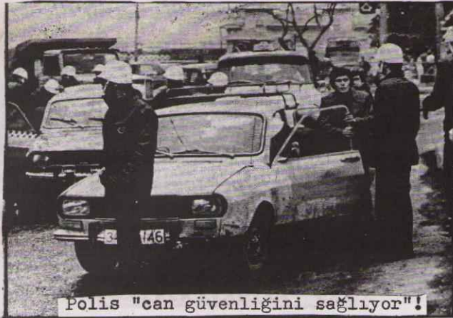
Polis "can güvenliğini sağlıyor"!

Yeni hükümetin programı 12 Ocak günü TBMM de Başbakan Ecevit tarafından okundu. Programda ilk bakışta göze çarpan noktalar şunlardır.