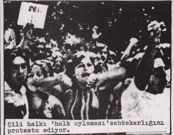
Şili halkı 'halk oylaması' sahtekarlığını protesto ediyor.

1973 yılında askeri darbe ile Allende hükümetini devirerek, Şili'de iktidara hakim olan Amerikancı faşist Pinochet, Şili halkına yıllardır kan kusturan faşist diktatörlüğü meşrulaştırmak için 'halk oylaması' sahtekarlığı düzenledi. Şili halkı, 4 Ocak 1978 tarihinde sandık başına giderek, faşist Pinochet'in başını çektiği faşist diktatörlüğü desteklemek için oy kullanmaya çağrıldı.