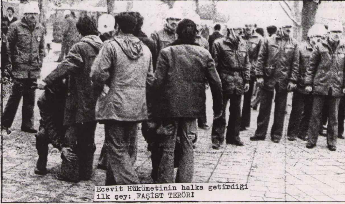
Ecevit Hükümetinin halka getirdiği ilk şey: FAŞİST TERÖR!

Yıllardır halkımıza kan kusturan, faşist uygulamalarla halkın nefretini üzerinde toplayan Amerikancı faşist MC hükümeti 1977 in son günü yapılan güven oylamasında çöktü. Daha önce AP içinde yer alan 11 'Milletvekilinin' AP den istifası, ve bunların güven oylamasında CHP ile birlikte oy kullanması bu sonucu doğurdu. MC nin parlamentoda yapılan güven oylaması sonucu yıkılması hakim sınıfların tüm sözcüleri tarafından "demokrasinin zaferi" olarak yorumlandı. Gerek batıdaki ve gerekse doğudaki emperyalist güçler de yorumlarında, güven oylamasının, ve oylama sonucu hükümetin istifa etmesinin Türkiye'de "demokrasinin sağlam bir biçimde yerleşmiş olduğu"nu gösterdiğini belirttiler.