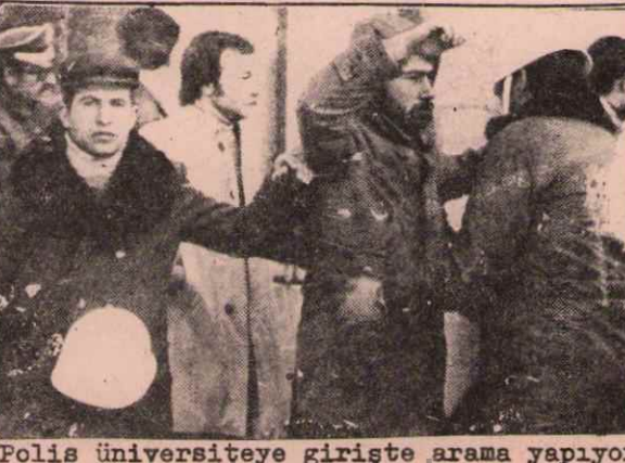
Polis üniversiteye girişte arama yapıyor

Gazi Eğitim Enstitüsü ile Erkek Teknik Yüksek Öğretmen Okulu arasındaki alanda devrimci öğrenciler ile komandolar arasında çatışma çıkmıştır.