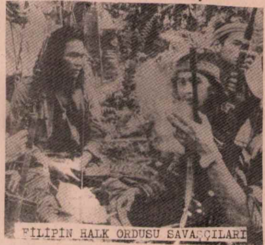
FİLİPİN HALK ORDUSU SAVASÇILARI

Filipinler de yıllardan beri sürdürülen halk savaşını kan ve ateşle bastıramayan faşist Markos yönetimi, devrimcilere bazı tavizler vermek zorunda kaldı. Markos yönetimi ile, devrimciler arasında yapılan görüşmelerde, devrimcilerin hakim olduğu Mindanao bölgesinde referandum yapılması konusunda anlaşmaya varıldı. Kaba hatla - riyle ortaya çıkan anlaşma, şubat ayı içinde yapılacak görüşmelerde son şeklini alacak. Anlaşmanın 7 martta Manila'da imzalanması bekleniyor. Faşist Markos yönetimi böylece ömrünü bir süre daha uzatmak istiyor. Ama manevralar boşunadır, Filipinlerde devrimci güçler, bu anlaşmadan devrimin menfaatleri açısından yararlanmayı bilecektir.