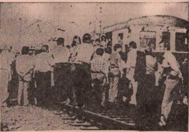
Haziran ayındaki ayaklanma sırasında bir treni işgal eden işçiler ...

Polonyada geçen yıl Haziran ayı içinde, partinin ihtiyaç maddelerine zam kararını açıklamasından sonra gelişen halk direniş ile ilgili mahkemeler sürüyor. Sosyal faşist mahkemeler şimdiye dek çok sayıda işçiyi 6 ay ile dört yıl arasında hapis cezasına çarptırdı. İşçi ve aydınlardan oluşan "İşçileri Savunma Komitesi" adlı bir komite, mahkemelerin gidişatını izleyerek bütün dünyaya ulaştırmaya çalışıyor. Bu komitenin, Haziran ayı içinde Radomda gelişen olaylarla ilgili hazırladığı, işçilere yapılan işkenceyi belgeyen dokümanlar batı basınında yayımlandı. Şimdi sosyal faşist yöneticiler bu komite üyelerine saldırıyor. Komite üyeleri mahkeme salonlarından dövlere çıkarılıyor. Yolları kesilerek, dövlüyor. Evleri "meçhul kişiler tarafından" basılıyor. Bütün bu faşist baskılar Polonya halkını yıldırılmaktadır. Polonya işçi sınıfı, bütün revizyonist ülkelerde en iyi şekilde teşkilatlanmış işçi sınıfı durumundadır. İşçi sınıfı her geçen gün daha geniş saflarda, sosyal faşist rejime karşı, kendi illegal KP si içinde birleşmektedir.