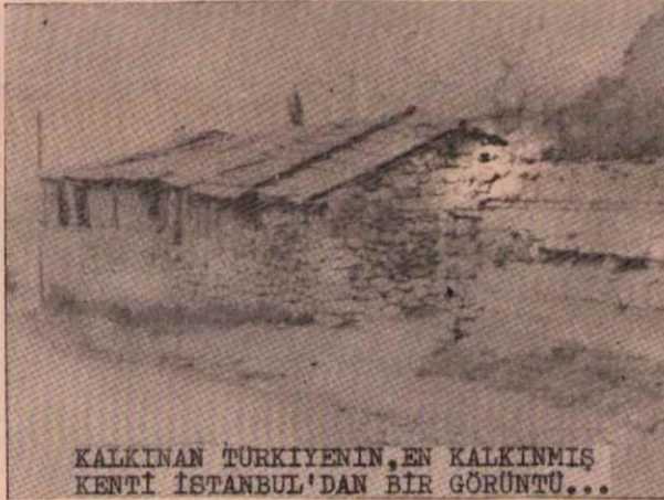
KALKINAN TÜRKİYENİN, EN KALKINMIŞ KENTİ İSTANBUL'DAN BİR GÖRÜNTÜ...

Türkiyenin çeşitli yerlerinde yapılan normal hesaplara göre,normal yaşama için asgari şu kadar paraya ihtiyaç vardır : GİRESUN'da: 3 çocuklu(yani beş kişilik) bir aile 7235 TL. PASINLER'de:5 kişilik bir aile 8000 TL. AĞRI : Çocuksuz bir aile 2715 TL. (Rakamlar Cumhuriyet Gazetesine yazılan okuyucu mektuplarından alınmıştır) Hal böyleyken,65 yaşını doldurmaya bağlanacak 1000 TL sın aşmayacak maaşlar yalnızca göz boyamak içindir.