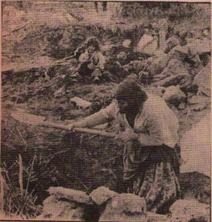
Deprem sırasında çocuğunu kaybeden bir ana, tek başına yavrusunun cesedini çıkarmaya çalışırken, diğer yavrusu da ağlayarak onu izliyor.