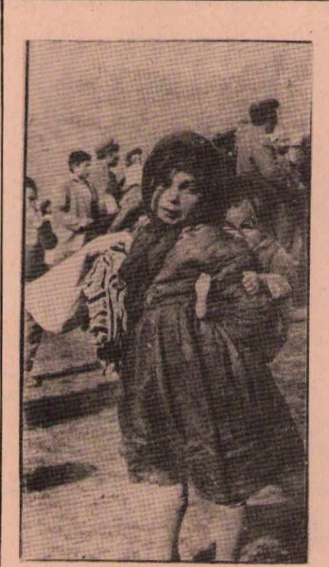
Açlık kötü bir şey. Deprem bölgesinde, özellikle çocukların gözlerinde açlık, yoksulluk ve yalnızlık iç içe...

İçinde 200 uyku tulumu, 40 kutup çadırı ve çokça televizyonun bulunduğu bir helikopter, deprem bölgesine gideceği yerde; halkın ifadesine göre "Antalya"ya gitmek isterken silvan yakınında düştükten sonra, çirkin olay aydınlanmıştır.