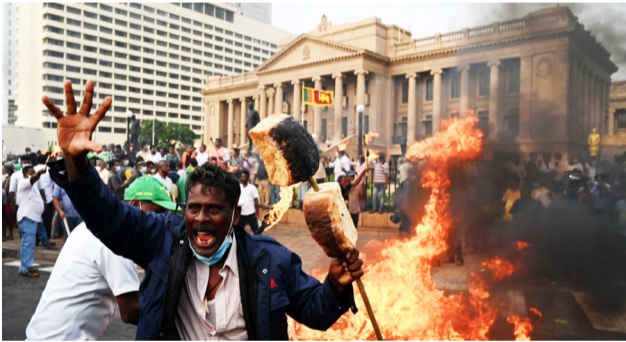
2022'nin ilk çeyreğinde dünya halkları ekonomik kriz ve yüksek enflasyona karşı kitlesel eylemlerle alanları zapt etti. Sri Lanka, Lübnan, Peru, Şili ve Hollanda 'daki eylemlerle dünya halkları egemenlere "buradayız" dedi.