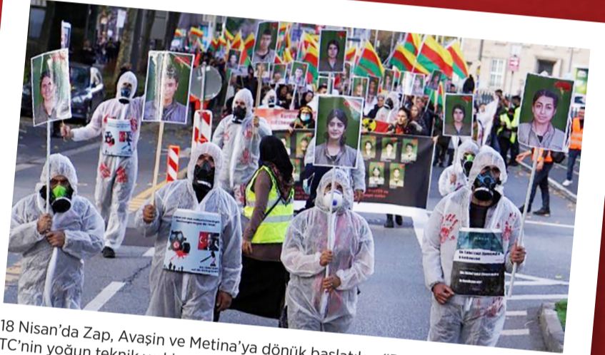
18 Nisan'da Zap, Avaşın ve Metina'ya dönük başlatılan "Pence-Kilit" operasyonu TC'nin yoğun teknik ve kimyasal kullanımına rağmen sonuç vermedi. Gerillanın destansı direnişine çarpan TC ordusu çareyi kimyasal silah kullanımında arıyor.