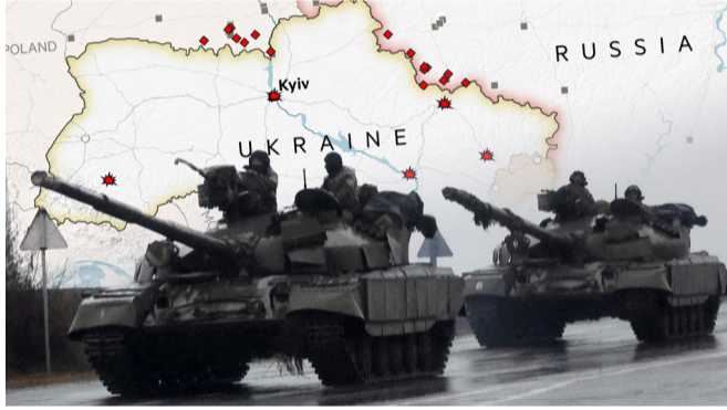
Rusya ile Ukrayna arasında devam eden gerginlik Rusya'nın 24 Şubat günü Ukrayna'yı fiili işgaliyle birlikte savaşa dönüştü. 10 ayı geride bırakan savaş boyunca 40 binin üzerinde insan hayatını kaybetti. Donetsk ve Lugansk referandumla Rusya'ya katıldı.