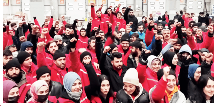
2022 asgari sefalet ücretinin açıklanmasından kısa bir süre sonra başlayan grev dalgası 60'a yakın işyerinde fiili eylemlere dönüştü. İnsanca yaşanabilir bir ücret için direnişe geçen işçiler büyük oranda kazanımlarla direnişlerini sonlandırdı. Eylemler önemli bir grev ve direniş olarak hafızalarda yer edindi.