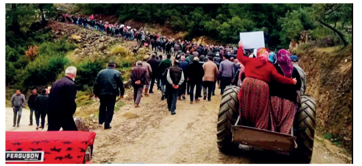
2022 yılı doğaya ve yaşam alanlarına dönük talan saldırılarına sahne oldu. İkizdere, Mezeköy, Germencik, Akbelen, İliç, Cudi, Çambükü ve İkizköy 'de halk talana karşı direnişteydi.