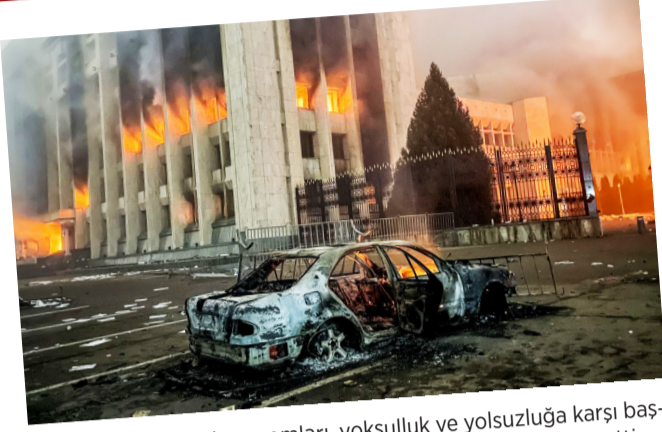
Kazakistan'da doğalgaz zamları, yoksulluk ve yolsuzluğa karşı başlayan eylemler 7 gün sürdü. Eylemler sonucu hükümet istifa etti.