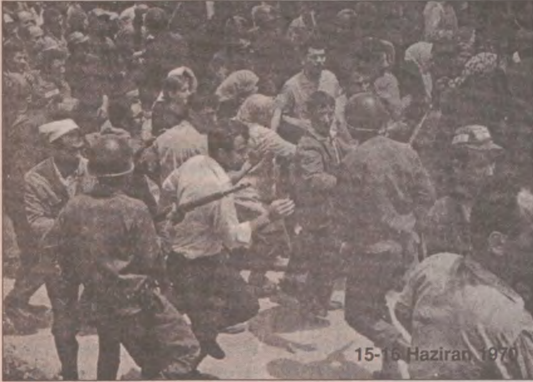
15-16 Haziran 1970

A çlığın, sefaletin ve zulmün had safhaya ulaştığı '70'li yıllarda, işçi sınıfımız yekini ayağa kalktı. Yıllardır üzerine birikmiş ölü toprağını bir kenara fırlatıp, militan ve azimli bir mücadeleye atılarak patronlara meydan okuyordu.