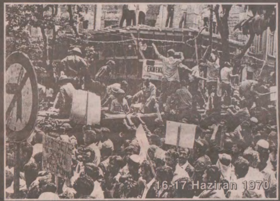
16-17 Haziran 1970

Özel mülkiyetin tarih sahnesine çıkmasıyla birlikte, sınıf mücadeleleri de tarihteki yerini almaya başlamıştır. Nedir sınıf mücadelesi? Ezilenlerin, sömürülenlerin, yaşamı varedenlerin, yaşamı yeniden yeniden üretenlerin, ezenlere, sömürülenlere, yaşamı tüketenlere ve zulmün uygulayıcılarına, onların sistemlerine karşı başkaldırısıdır. Sömürü ve zulmü yok etme mücadelesidir. Emekten yana, insanca yaşamı tüm insanlığın hizmetine sunma mücadelesidir.