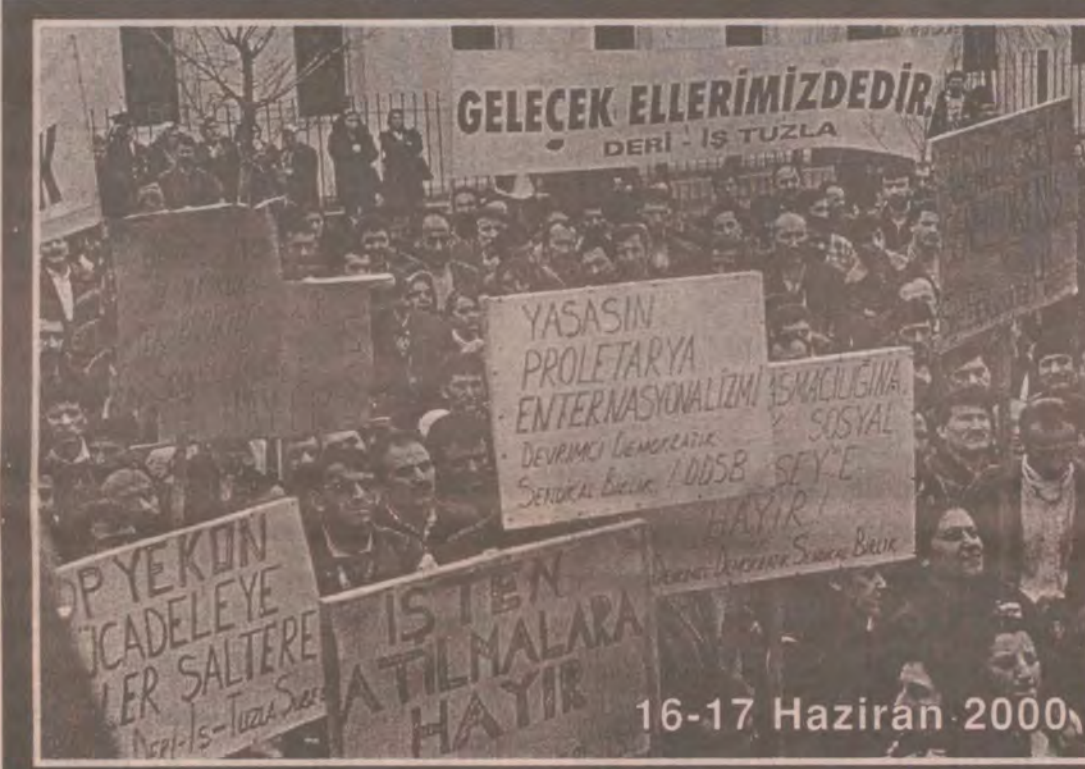
16-17 Haziran 2000